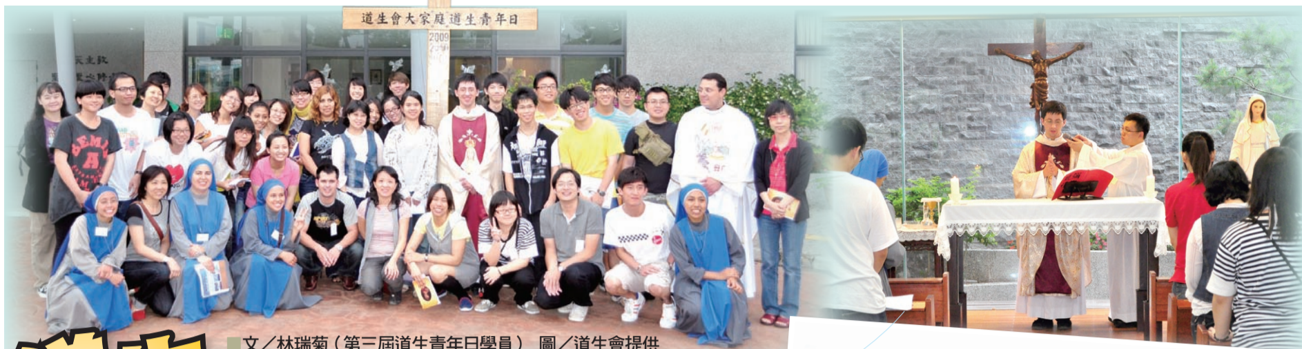
文／林瑞菊（第三屆道生青年日學員）