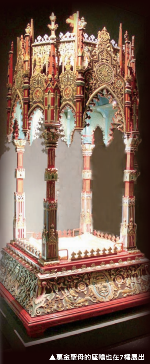
▲萬金聖母的座轎也在7樓展出