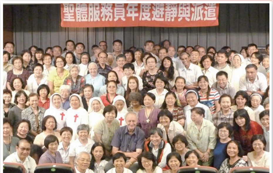
▲台北總教區150位原有的送聖體服務員與50位新進者，一同在避靜中歡喜充電，並接受派遣。

吳神父用說、唱、國語、台語、英文、拉丁文交互穿插，循序漸進地介紹了耶穌福傳3年的約200里艱辛路程，完成天主派遣的使命。聖體服務員當然要隨耶穌的腳步，將耶穌的心與愛