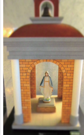
▲萬金聖母聖殿的美麗典雅內裝。 ▲此模型依據萬金聖母聖殿旁邊的聖母公園鐘亭製作。 ▼萬金聖母聖殿1:40的建築縮影將在宗博館展出至9月18日。