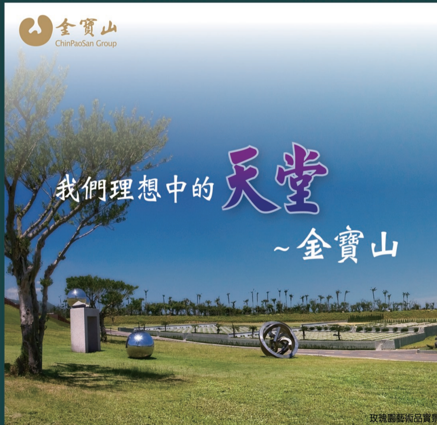
玫瑰園藝術品賞景