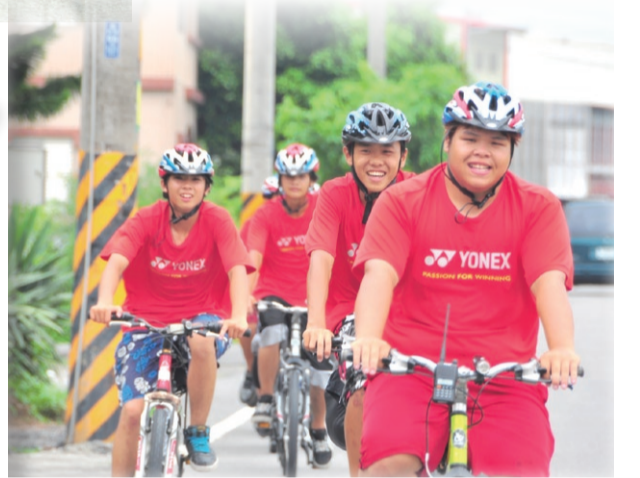
▲蘇花公路環台最後一段艱鉅行程，善牧團隊朝著學園奮力騎乘。

影響了其他成員，負向、低迷氣氛籠罩團隊，經過不斷溝通與對談、接納及交心，小小六終於感受到隊友的愛，有愛，讓大家互相扶持一起堅持下去。