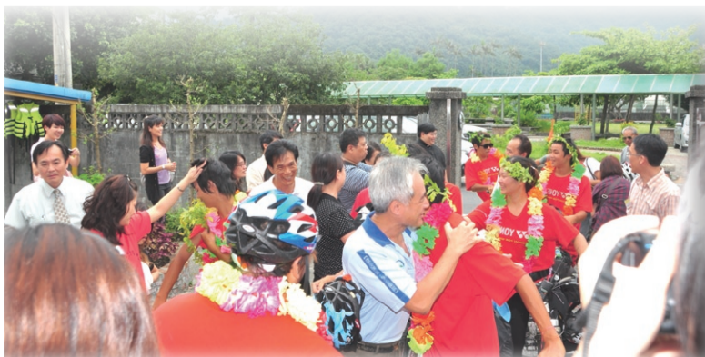
◀家人們送上繽紛花圈及草編頭環，用擁抱與最熱烈的掌聲歡迎他們回來。

隊友中最過動的小小六因為情緒控制力較差，無法適應每天正常作息規範，以及日復一日的唯一任務——騎乘單車，在第2天就揚言要搭車回家，這情緒