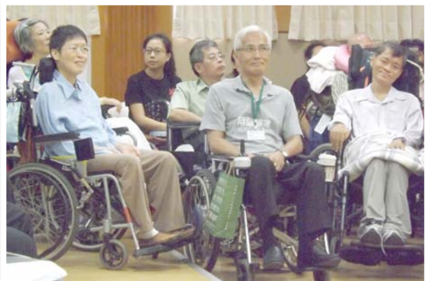
▲漸凍病友們全都來到新書發表會場，為彭老師出版新書而致賀。

至於那些已全心準備好接受天主召喚的生命，重要的並不是利用醫療設備將他們痛苦地強留在家人身邊，而是用愛陪伴他們走完生命的最後一程，讓這些末期病人以更有尊嚴的方式準備好身、心、靈等待返回天鄉父家的時刻。我想，這也是我們台灣社會仍需在「生命」看法上繼續對話和努力的空間與方向。