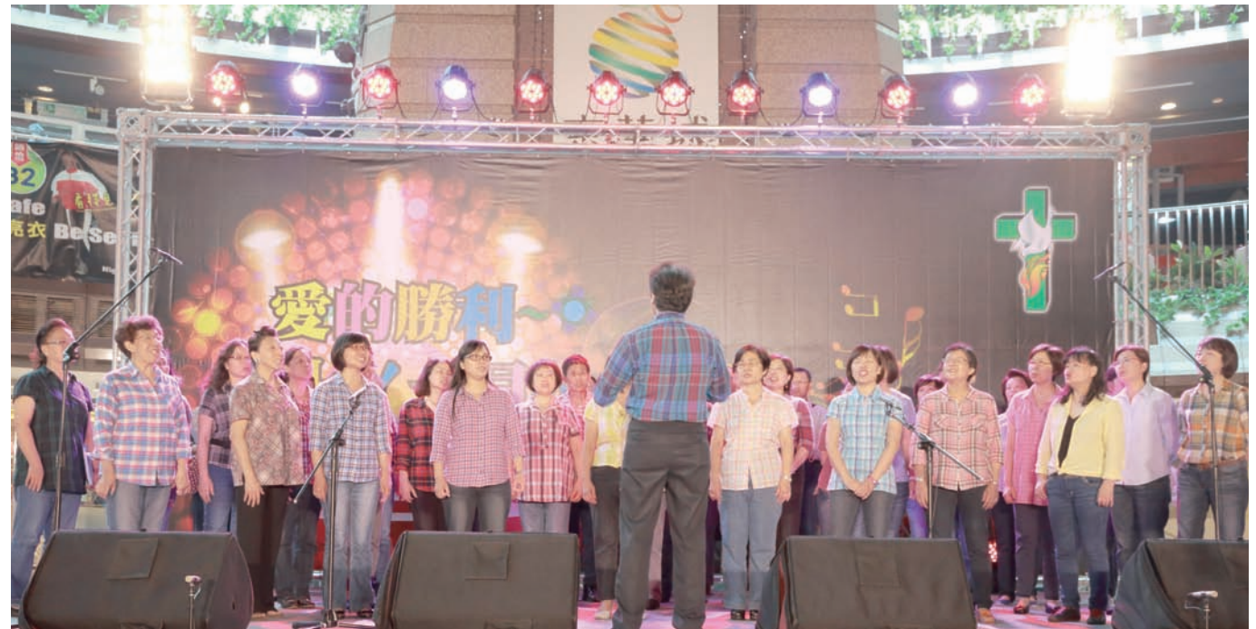
▲大坪林聖三堂聖詠團、木柵復活堂聖詠團和革魯賓合唱團大合唱《愛的勝利組曲》。