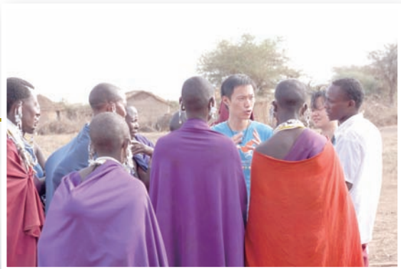
▲與婦女們家庭訪問中。

回憶起去年教學的經歷，與今年2015團隊分享：「我覺得坦尚尼亞的學生其實各個口才頂尖，只要站到台上很自然的會散發自信，上課也踴躍表達觀點或發言問問題。一次上完兩性平等，學生傳來一張紙條：『為什麼白人比黑人好？』第一瞬間的心情是極致的難過，再來駭然失色，我的學生怎麼會有這樣的觀念？於是兩性平等課瞬間變成平等課。我先反問他們為什麼這麼想，卻得要台下鴉雀無聲。Nobody is better than anyone else，開始了我的小演講，You must believe in yourself and find your significance in this world作為結語。短短10分鐘的回答，我越講越亢奮，熱血不停的燃燒，也看到台下的學生開始微