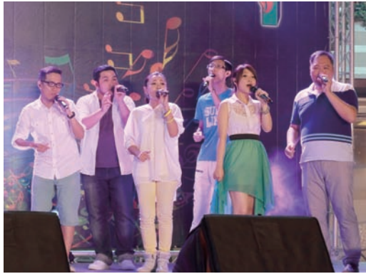
▲神秘失控人聲樂團美聲感人肺腑。