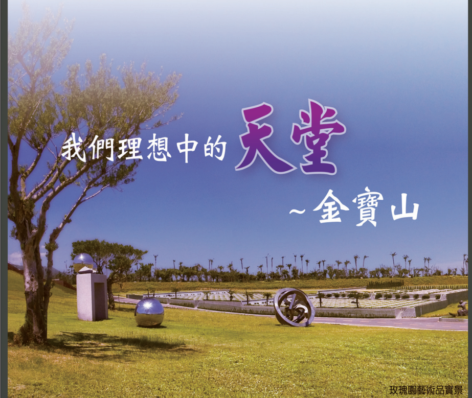
玫瑰園藝術品賞景