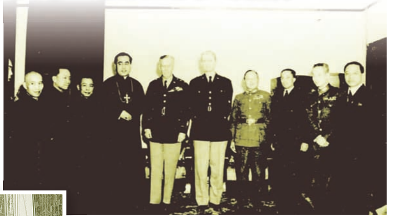
▲抗戰時期的于斌主教（左四）及左起劉公、谷正綱、梁寒操、馬歇爾將軍、魏德邁將軍、何應欽將軍、俞鴻鈞、孫立人將軍、黃仁霖等人。

今年是抗戰勝利70周年紀念。回想聖教宗若望二十三世於1959年任命在台負責籌備輔仁大學復校的于斌總主教於抗戰時期為國奉獻的史實，今人已知之不多了。抗戰開始時，當時的于斌主教得到教宗碧岳十一世的降福，使他能發揮極大的宗教熱忱，順利地在全球開展救助難民的工作，努力完成救國救民大業直至勝利。于樞機以天主教主教的身分對苦難的國家做出極大的貢獻，充分顯示出天主教教士愛人如己，愛人勝己的精神，這段歷史令人動容。