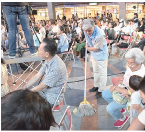
▲志工服務細心入微。