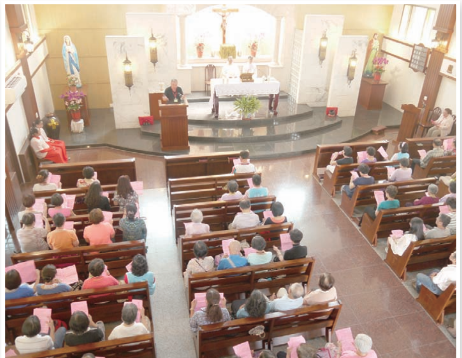
▼新店中華聖母堂教友南下羅厝天主堂朝聖。