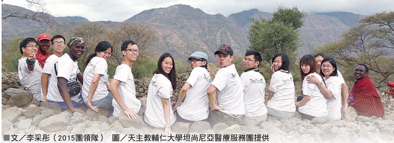
■文／李采彤（2015團領隊）

遠在東非坦尚尼亞的Engaruka馬賽部落，幅員遼闊，面積好比是新北市的大小，距離最近城鎮約3小時車程。部落裡1萬人口散落在各角落，卻只有一位醫生及兩位護理師守護著當地僅有的一間診所，這1:10000的醫病比，遠高於WHO建議的1:1000。