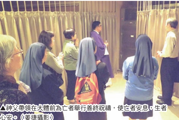
▲神父帶領在大體前為亡者舉行善終祝禱，使亡者安息，生者心安。

談到善終祝禱，就會談到死亡，死亡是人生最大的難題。死亡的議題，雖然很沉重，但死亡的覺察及了解死亡的意義，是為了作出對它的超越與昇華，強化了永生信念。