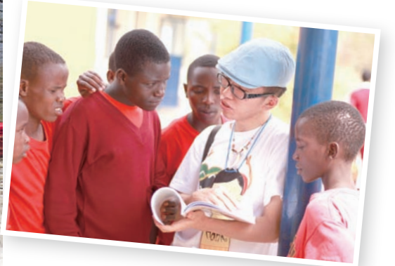
◀2014團的我們。▼課後學生依然積極學習，找我們問問題。