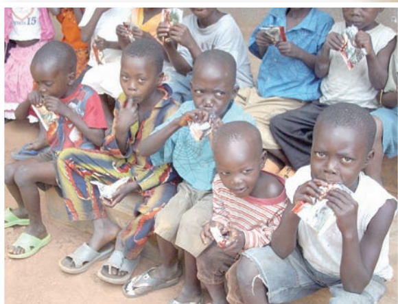
▲彩虹之家協助建造和修復茅草屋

女性是南蘇丹社會的樑柱，儘管面對許多的障礙，由於她們與生俱來的能力和貢獻，才能使那樣的社會在數百年的部落衝突，殖民主義外強剝削和長年內戰中存活。同樣的讓我們的天主教會在當地得以保全，藉由天主的護佑，眷顧這些人。