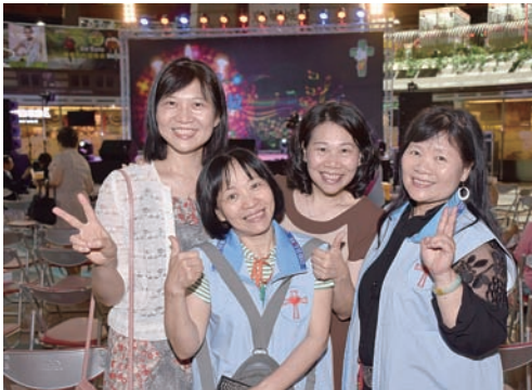
▲教友幹部互相力挺。