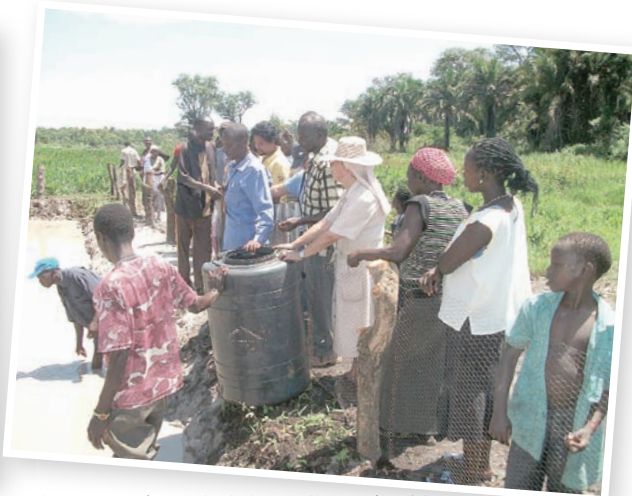
▲金邦尼修女會的彩虹之家是南蘇丹社會的橋樑