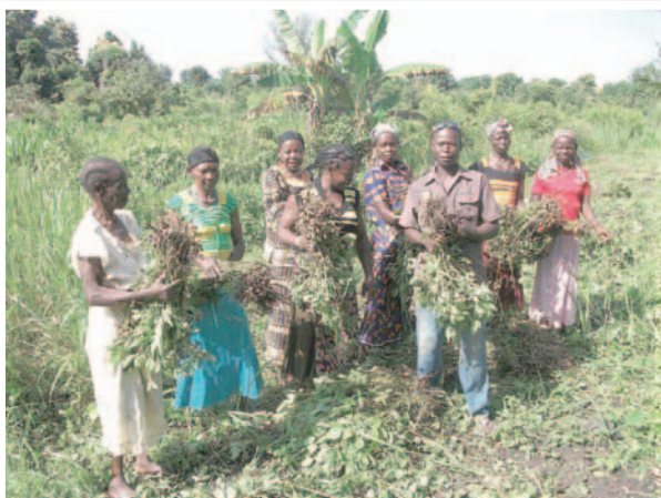
▲在田地裡工作的婦女

耶穌基督說：你們為貧困人們所做的善事，就是為我做的。應向窮人伸手施惠，好使你的祝福和憐憫，完備無缺。