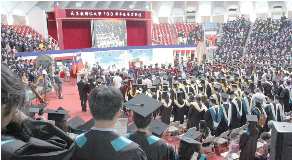
▲輔大畢業典禮，融合有機蔬果的時代潮流，別出心裁。