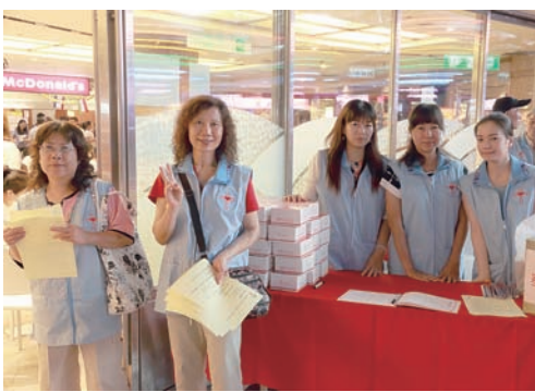
▲天主教志工隊熱情有禮。