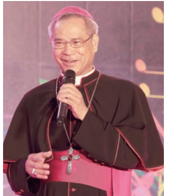
▲洪山川總主教致辭。