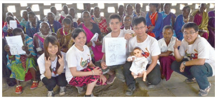
▲衛教完畢後與教堂婦女們的合影，每人手上都有翻譯成當地語言且充滿圖解的衛教單張。