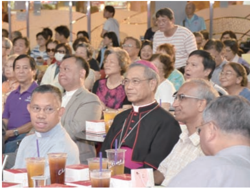
▲神長和教友同心推動網路福傳。