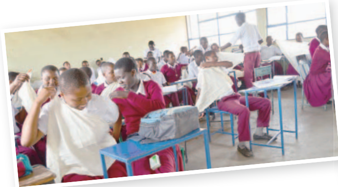
▲中學生在傷口包紮課興奮地拿著我們從台灣募來的三角巾，迫不及待的開始試綁。

在他們的眼裡我們或許很厲害、很厲害，但我們都還是學生，專業診斷不在我們的能力範圍內，衛教就是我們能給的，也是我們會努力做到最好的！藉由一年又一年的衛教累積，把種子種在部落民眾的心中，並發芽茁壯，期待開枝散葉到整個馬賽部落。（文轉23版）