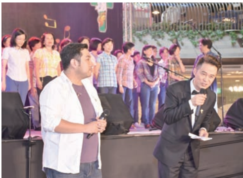
▲台上台下，其樂融融。