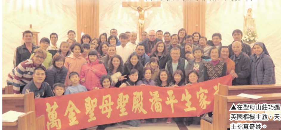
▲在聖母山莊巧遇英國樞機主教，天主祿真奇妙。

下山時，沿路跟著神父念玫瑰經五端，腳步變輕了，腳程變快了。該是道別的時候了，這一趟家族朝聖之旅，身體很疲憊，心靈充滿卻恩寵及喜悅。很難得的事，是我們家的兄弟姐妹都參與，這是在我們長大成家之後的第一次，期待著明年的家族旅遊，帶給我們更多的感動。