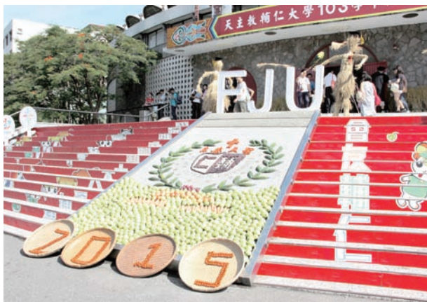
▲中美堂外的蔬果布置