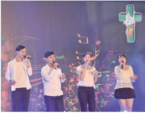
▲跨教區的教仔人聲樂團。