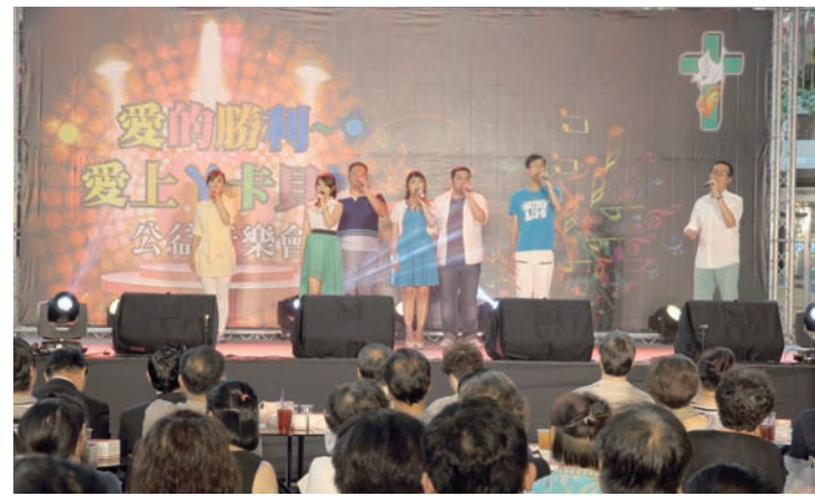
▲台下觀眾凝神聆賞神秘失控人聲樂團的演唱。