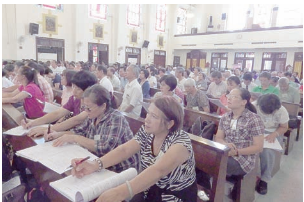
▲IMGP新竹教區培訓座無虛席。

「魚」之寓意是耶穌是我們的唯一救主。耶穌對門徒說，你們不要煩亂，我去是為給你們預備地方，之後，我會再來接你們到我那裡去。（參閱若14:1-3）耶穌先我們而去，並為我們準備了一個住處，就是我們可以同祂