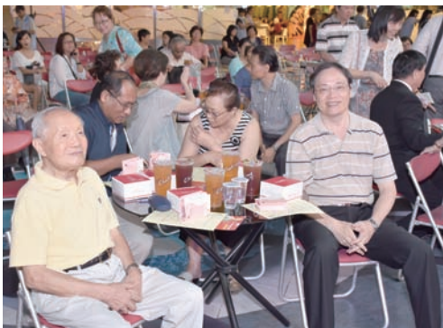
▲世代教友喜樂共融。