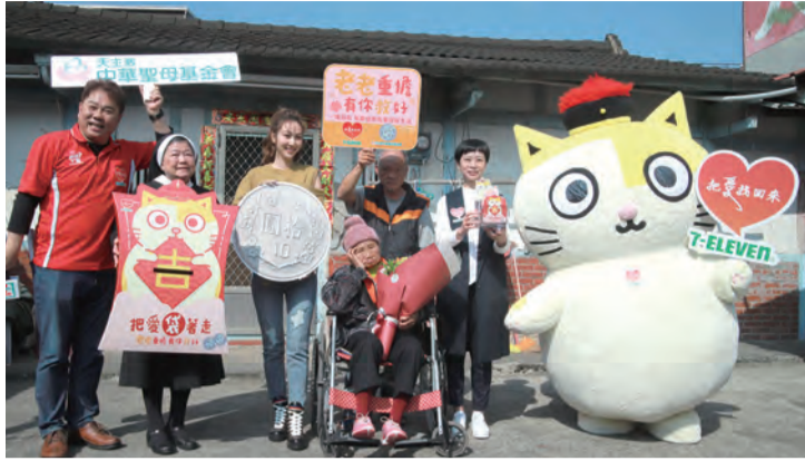
▲響應「老老重擔，有你救好」計畫開步走，全面照顧長輩。