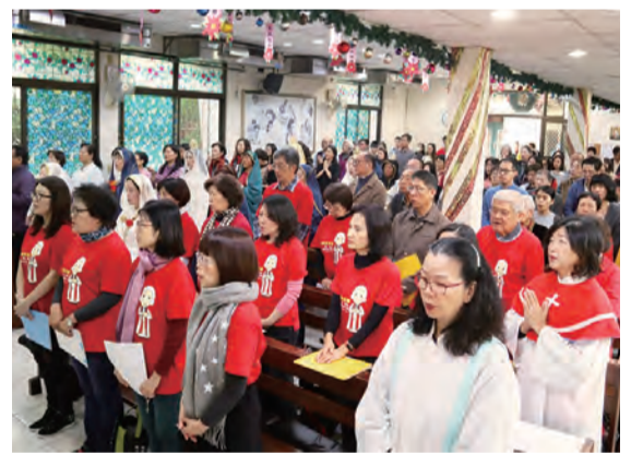
▲南屯堂在2020年元旦天主之母節舉行堂慶彌撒

孩子，我愛你！我深切盼望你知道我是誰！」細數堂區內善會團體及各種才藝班，大家熱烈討論後，大夥有志一同地覺得棋藝既有互動效果，也能引起興趣，關主展現各地聖母顯現特色，透過介紹立牌及Q&A方式，定能加深教友們對聖母的認識與印象。