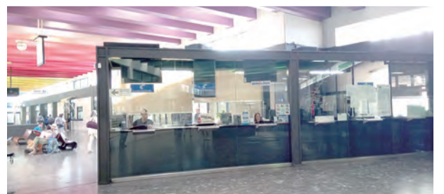
▲Finisterre的巴士站有著溫暖的人情，令人難忘。