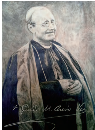
▲杜敬一神父繪〈會祖聖孔維鐸〉

1920年，聖方濟·沙勿略會的會祖聖孔維鐸（1865-1931）在帕爾馬主教任內期間，以一位父親及牧者的心情，完成了遺囑，主要是為引導會士們回應聖召，成為具使徒精神、崇高理想的福傳者；天主所賜的最大恩寵莫過於聖召，使人放下自我，效法宗徒，無悔追隨基督。