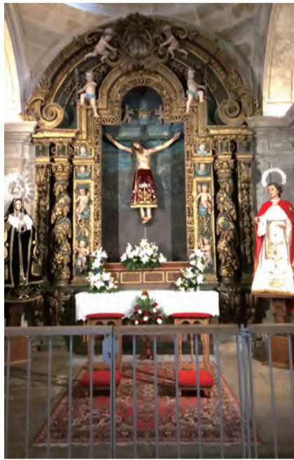
▲Finisterre的聖堂內，穿著裙子的苦像。

第2天，我們打算從Finisterre搭乘返回Santiago的直達車，從旅館走往巴士站時我們竟然迷路了，沿途找路、問路，等我們到達巴士站時，還很慶幸巴士站空蕩蕩，車還沒到站，此時，有個年輕女子像憑空冒出來似的，