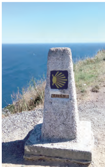
▲海角之路的0公里起點