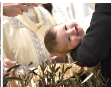
▲在父親懷抱中接受教宗方濟各付洗的小嬰兒，轉頭露出可愛的微笑，讓西斯汀聖堂充滿溫馨。 ◀教宗方濟各於主受洗日，在西斯汀聖堂為32名新生嬰兒施洗，表達開啟信仰的深切意義。