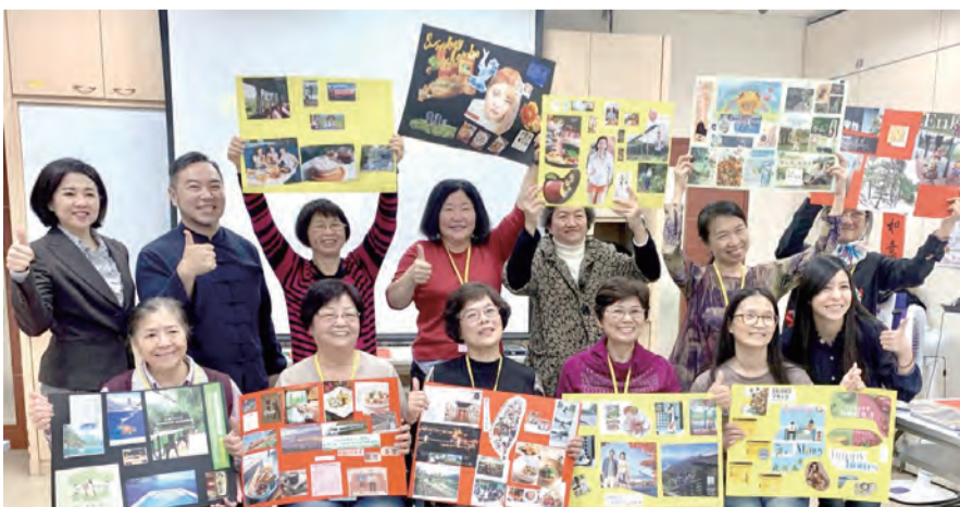
▲萬華老人服務中心「活出健康——生活再造實作班」預防暨延緩失智課程，第1梯次結訓成果發表全體大合照。