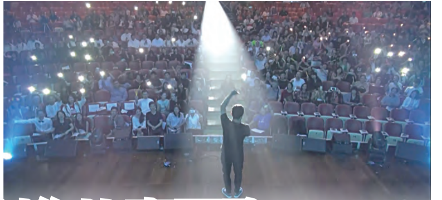
▶第2屆真理杯演出盛況