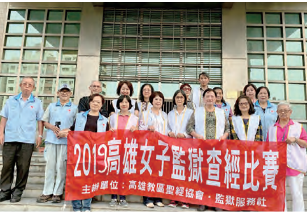
▲將聖言帶給需要的人，福傳有堅實的基礎。

遠古時代，上級人士是由下屬的行為而受判斷的。因此，管家在這比喻中的舉動使富翁處於可恥的地位。富翁根據傳聞（參閱16：2a）來評判他的管家這一事，證實了主人所關心的是自己的榮譽。學者指出，榮譽可通過挑戰來獲得，而家庭之外的任何社交互動都被視為對主人榮譽的挑戰。主人無力控制比喻中的管家已