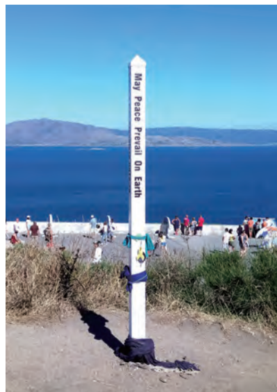
▲海角之路盡頭的世界和平祈禱碑