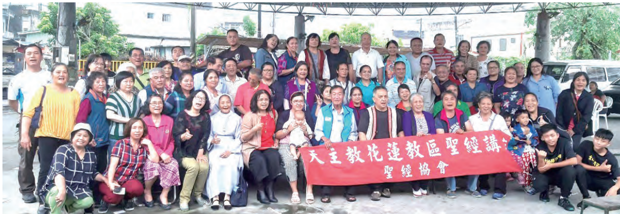
▲鼓勵教友們參加聖經研習活動，共融於聖言中。

管家的作法，即減少主人債戶的債務，可被視為「和好行為」；主人的榮譽恢復了，他在朋友眼中再次得到尊重，因為他已表示有能力管理自己家務。現在，主人和他的管家也一樣和好了。一切是因為這管家精明的作法。因此，耶穌說：「這些今世之子應付自己的世代，比光明之子更為精明。」（路16：8b）