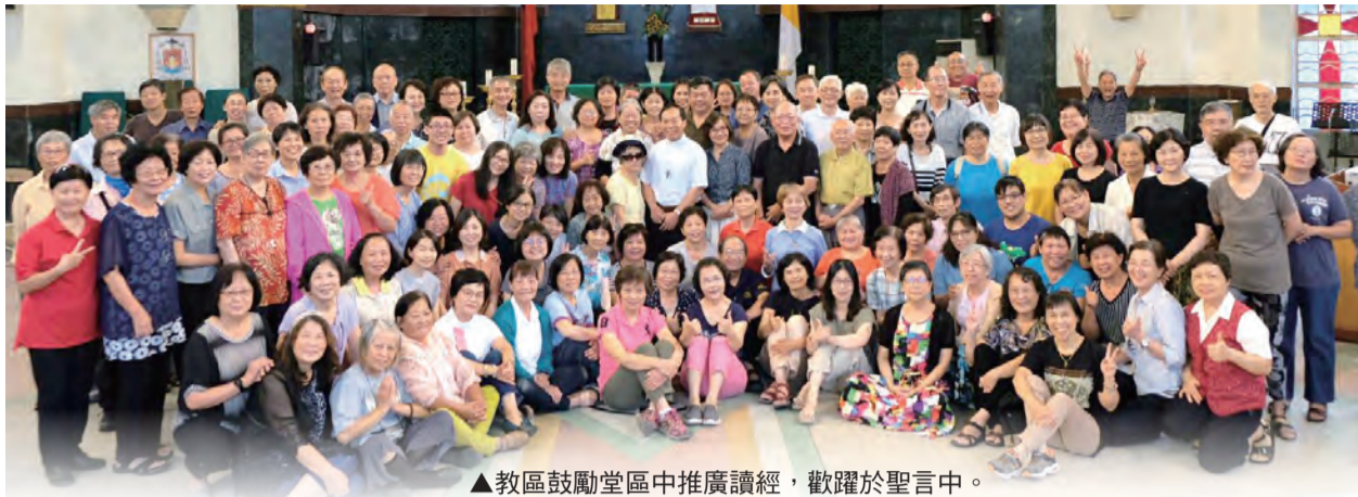
▲教區鼓勵堂區中推廣讀經，歡躍於聖言中。

教宗最後告誡道，「絕不可以一成不變的方式解讀天主聖言」，因為天主聖言總是以新的方式「喚起天父的慈悲大愛，而天父也要求祂的子女在愛德中生活……天主聖言能開啟我們的眼目，使我們走出引向窒息和荒蕪的個人主義，走上與人分享和團結互助的道路。」