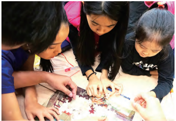
▲在遊戲中吸引學習興趣，提高對聖言的認識。

生活在第1世紀地中海的人們感覺到他們有權履行他們所繼承的角色和地位，而此地位是由統治他們社交活動的榮譽和聲望所象徵。高名聲的人知道如何活出並履行自己所繼承的義務，即是沒有去侵犯他人權力也沒有被他人利