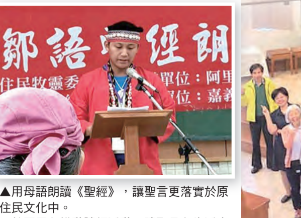
▲用母語朗讀《聖經》，讓聖言更落實於原住民族文化中。 ▲教區用心推動讀經活動，讓聖言在生活中滋養我們。