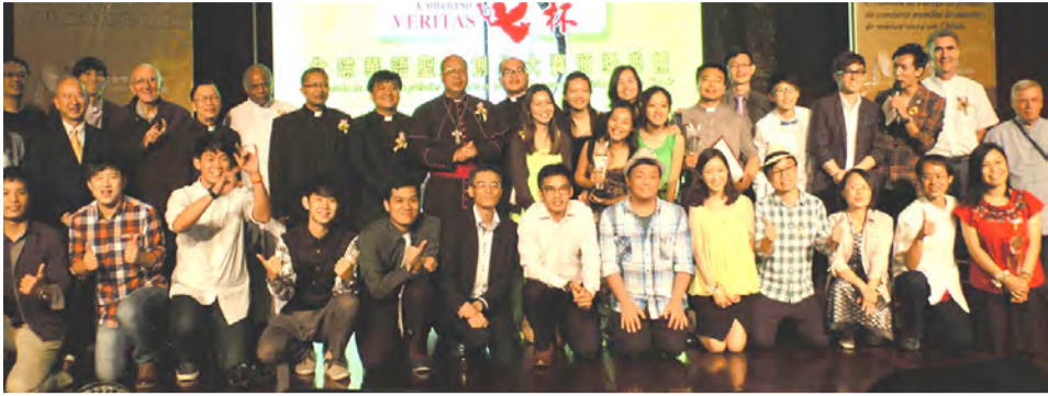
▲首屆真理杯華語聖歌頒獎大合照