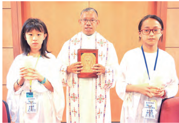
▲從兒童開始重視聖言，讓讀經風氣在家庭中滋養。

有些學者辯稱，該比喻實際上在16章第7節結束，而耶穌在第8節中給出解釋。因此，第8a節中的「Ho Kyrios」是指耶穌，祂闖入了故事本身並稱讚這不義的管家。然而，另一些學者