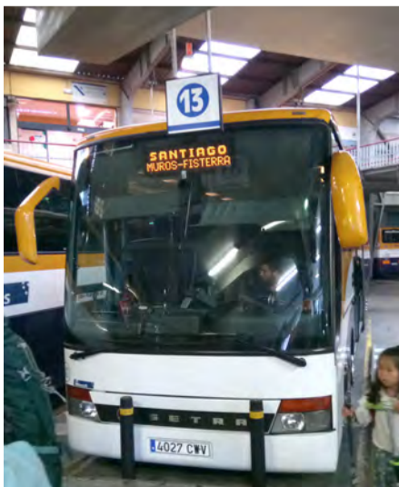
▲返回Santiago的巴士，給了我們一段與天主聖三相遇的美好體驗。

回來後的這幾年，持續投身在門徒讀經班的事工，不時念起聖三在Finisterre顯現啟示給我的教導。藉著門徒讀經的課程，希望自己能指引教友望向天主的方向，溫柔耐心地駕著聖言的巴士，一同駛往新天新地的0公里。