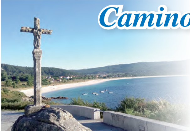
▲Finisterre海邊的美麗十字架

在哥倫布發現新大陸之前，歐洲人始終認為西班牙的Finisterre就是世界的盡頭。許多朝聖者抵達Santiago之後繼續前行，走向這盡頭，在Finisterre的沙灘上燒掉所有的行囊，象徵「蛻去老我，迎接新生」。因此，我們決定繼續朝聖的行程，走這一趟海角之路，不過，這次是搭巴士啦！