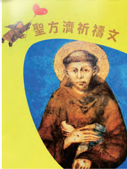
▲◀潮靈修之參考書籍《仰瞻上主》及《聖方濟和平祈禱文》

「潮」亦有流行、平實、親切、容易共鳴之意，所以，研習課程不在於神學或學術的艱深鑽研，而是具體生活靈修的實用操練，讓生命更扎實，使生活更如意！