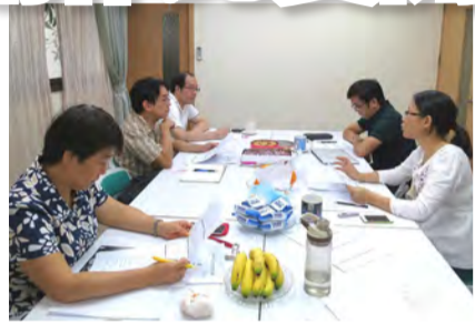
▲評審們認真討論參與者創作的特色