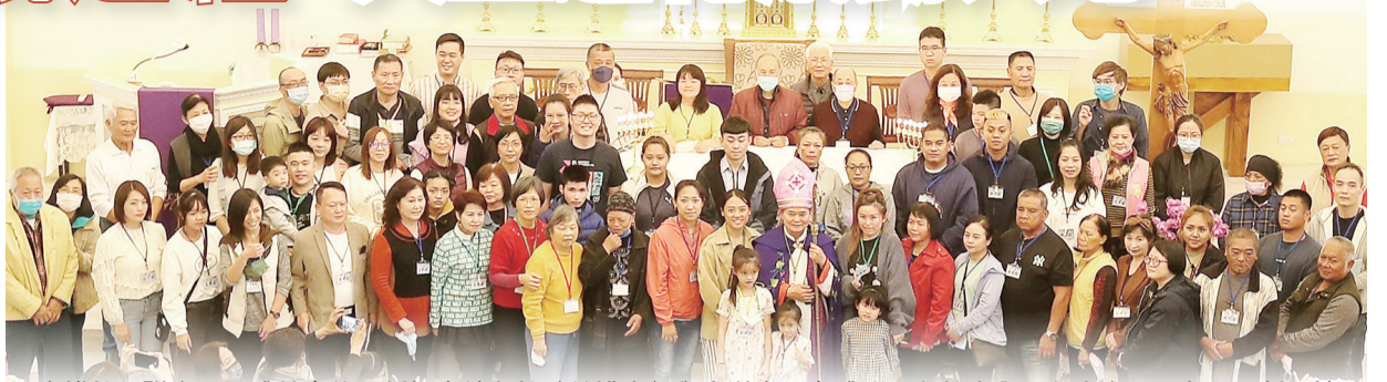
▲高雄教區聯合甄選禮結束後，劉振忠總主教（前排中）與求道者及參禮群眾在教堂內開心大合照，留下深刻回憶。

每年的求道者，都有讓人感動的歸依故事。今年，一對9歲和4歲的姊妹。有天，妹妹路過一間外觀像城堡的教堂，並告訴母親想進城堡，母親便說這是基督教堂，要帶她們去天主教城堡。姊姊又問，如何進入城堡？於是，大學時領洗、婚後未進教堂的母親，因女兒的一句話重啟進堂之路，兩位女兒也成了求道者。