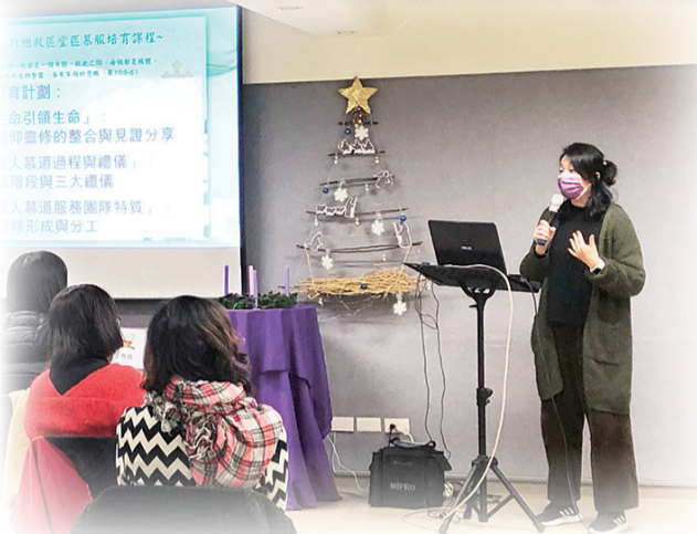
▲慕道班服務團隊培訓課程讓學員分組討論，分享彼此經驗，分工合作完成作業，建立團隊合作之精神。

緻，我們堂區11位慕服團隊成員齊聚一堂，參與線上課程，討論如何做，過程中和樂融融。救恩史的介紹，透過時間軸一一貼上圖片，好像也把救恩貼到我們的心版上。在複習遊戲中，交換牌卡配對的過程，我們從一開始努力地找自己想要的圖卡，轉變成看到他人的需要，主動給出自己的牌卡；似乎每人皆已不在乎自己分數的高低，只求全員完成任務。