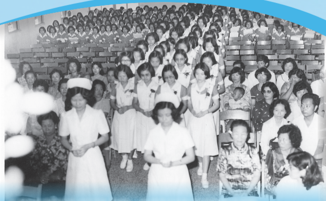
▲學生舉行加冠儀式後，派遣到各個醫院實習。