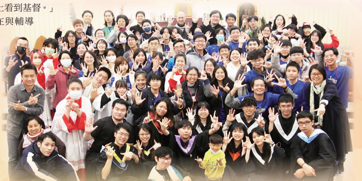
▲大專同學會第97屆陶成營圓滿落幕，青年們矢志為主作信仰見證。