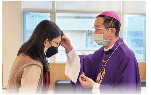
▲鍾安住總主教(右)施放聖灰，期勉教友於四旬期定志悔改，多行刻苦及愛德善工。

台北總教區於2月22日，在總主教公署3樓小聖堂舉行聖灰禮儀彌撒，由鍾安住總主教主禮，藉著禮儀進入深具意義的四旬期。