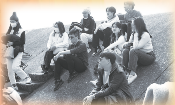
▲大專同學會信仰陶成營，引領許多青年虔心向主。

這次的陶成營讓我看見了更新的改變，從過去不會讓我們出營區的活動，到現在讓我們步入社區、環境、人，我深刻地感覺陶成過程比以往更加的有趣，期待能夠再次去參加98陶成營，也非常推薦陶成營給那些還未參與過的大專同學們！