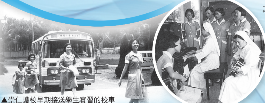
▲崇仁護校早期接送學生實習的校車