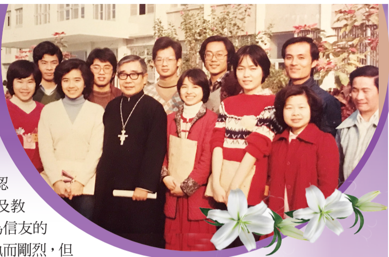
▲1981年2月15日，狄剛總主教與中國天主教大專同學會幹訓營的學員們合影留念，後排中為本文作者。

◀1998年2月，狄剛總主教（左二）拜訪主業團女生中心，當時主業團東亞大區的代表，羅瑞文蒙席也在場陪伴，小女對狄總主教的小圓帽很好奇，他慈愛地給小女戴上。