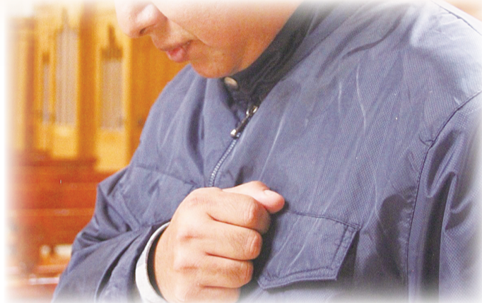
▲彌撒中教友念懺悔詞時，以手捶胸，悔罪面向天主。

在耶穌苦難時，路加又提出兩次平民捶胸，表示苦痛之情：「有許多人民及婦女跟隨著耶穌，婦女捶胸痛哭祂」（路23：27）；「所有同來看這景象的群眾，見了這些情形，都捶著胸膛，回去了」（路23：48）。在彌撒中，信友該想，耶穌之所以經