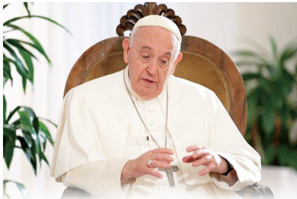
▲教宗方濟各日前接受採訪時重申，教會面對侵犯案，將以最嚴厲的態度對待，絕不容忍這種暴行。

在教會，這種全球性的殘酷行為顯得更嚴重和更令人憤慨，因為它與教會的道德權威和倫理信譽全然不容。天主所揀選，為引領人靈獲得救恩的奉獻生活者，被自己人性弱點或疾病所支配，成為撒旦的工具。在傷害中，我們看到邪惡之手不放過純真的孩童。這些涉及兒童的虐待行為無可辯解。我們必需以謙卑和勇氣，辨認出我們是在面對惡神，它對最脆弱者攻擊最為猛烈，因為他們是耶穌的肖像。