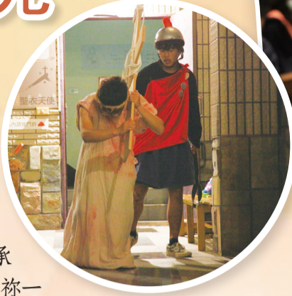
▲神父為青年覆手降福，鼓勵青年們勇敢地站到燈台上，照耀世人。 ◀透過真人苦路福音劇，默想耶穌為世人受難犧牲的意義。

談話中，輔導希望我思考：為什麼這句話會影響我這麼深？為什麼天主要給我這個使命？這兩個問題成為我這趟旅程中最寶貴的禮物，就如同這次的營標，我們是地上的鹽，世界的光！我相信每個人都有自己的使命，只要做自己就夠了，因為祂愛我們原本的樣子。