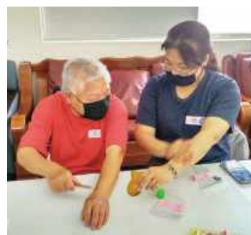
▲母女練習運用刮痧板按摩穴位。

目前逐步建構中，設立失智據點就是其一。失智症屬於進行性之腦部退化症候群，發病後餘年約有7到8年，有些甚至延長到15年左右，