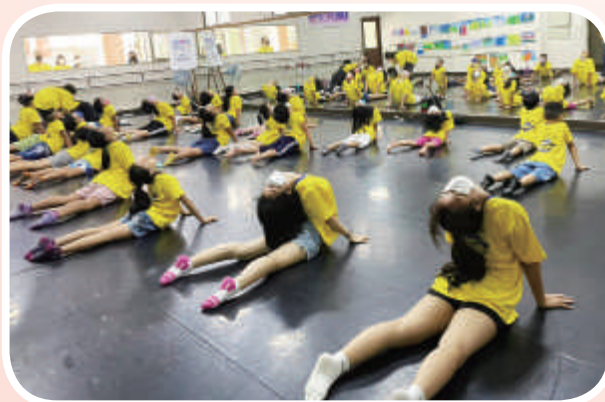
▲孩童們練習伸展肢體，以呈現更好的舞蹈美姿。