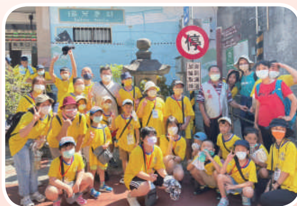
▲育化藝術夏令營的孩子們，彼此陪伴，見證主愛。