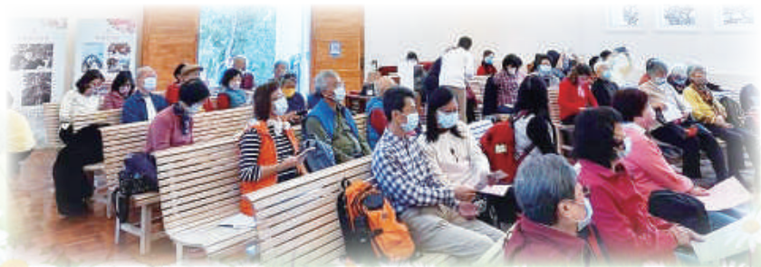
▲神修小會共融營在耶穌堂參與彌撒，有個特別的回憶。

與大家分享這件事情，希望我們也能夠向胡神父學習，成為更接近聖母、更像聖母的好基督徒！