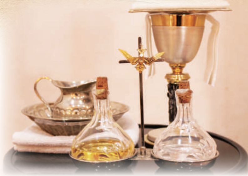
▲彌撒中，司鐸需祝聖餅酒，分施耶穌聖體聖血給信友們。

關於酒，在《舊約》中，酒指出喜樂和幸福：「飲酒有時有節，使人心裡高興，精神愉快。」（德31：36）按當時猶太人的觀念，酒也代表血，是生命的象徵，因此有一些舊約的儀式規定要奠酒，祭酒（參閱戶4：7；