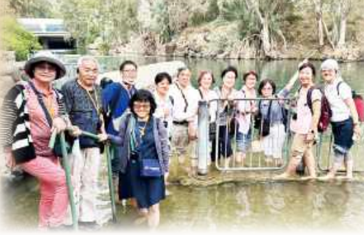
▲在約旦河朝聖者彷彿重獲新生，願化為泉水，滋潤身邊如曠野般乾涸的心靈。

我常作出讓主心痛的事。直到來到聖地，幫助我讀經時，更能親身感受曠野的環境，這裡是夢寐以求的聖地。