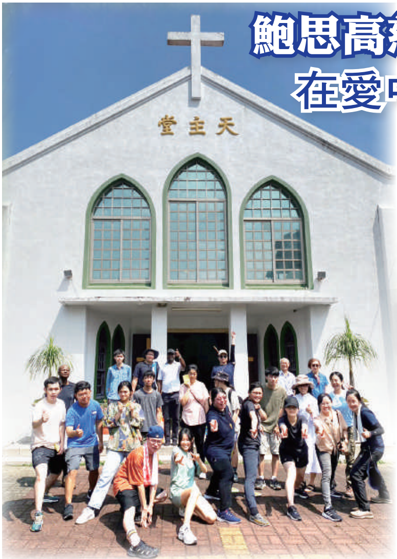
▲青年朝聖者們在萬巒聖母元后堂前合影，熱切盼迎世青。