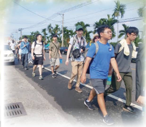
▲體驗徒步朝聖，每一步都是對走向天主的渴望。

每屆世界青年日都吸引全球各地的青年人前往參加，本屆以「瑪利亞急速啟程」為主題，在葡萄牙里斯本舉行。台灣的鮑思高慈幼會這次也組織了一個朝聖團，共有30位青年一同前往，由我帶領整個朝聖團，另外也有兩位慈幼會會士，以及一位中華道明修女會的修女結伴同行。