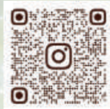
▲歡迎追蹤慈幼會台灣世青團IG