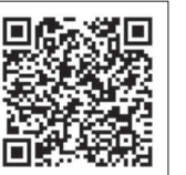
▲觀賞《兒童參與彌撒》影片

與孩子一起參與感恩祭，讓信仰生活的核心支柱，成為孩童生根於信仰的大家庭——教會之中，這將是每位家長願意傳承給子女的。在此，僅以淺顯的信仰生活經驗作分享，邀請更多家長運用適合自己孩子的方法，和孩子分享感恩祭與聖言，好能幫助孩子開啟心靈，讓信仰進入心房，與天主相會。