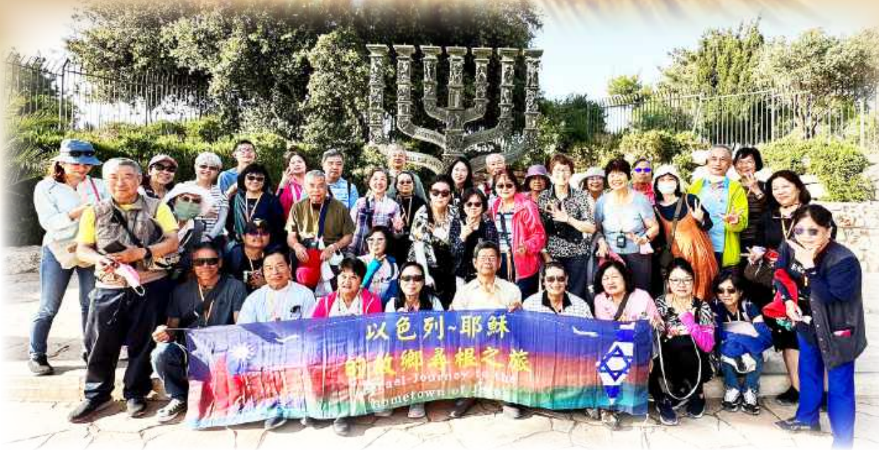
▲來自台、美、泰及中國互不認識的朝聖者，從桃園機場就一路相互扶持，在主內成為一家人。

來到耶穌的故鄉，親身體驗祂當年所走的苦路，祂所受的一切委屈都只為光榮天主，我無法想像耶穌如何度過這一切。當面對任何困境時，我願以耶穌的苦路來反省，幫助我更貼近