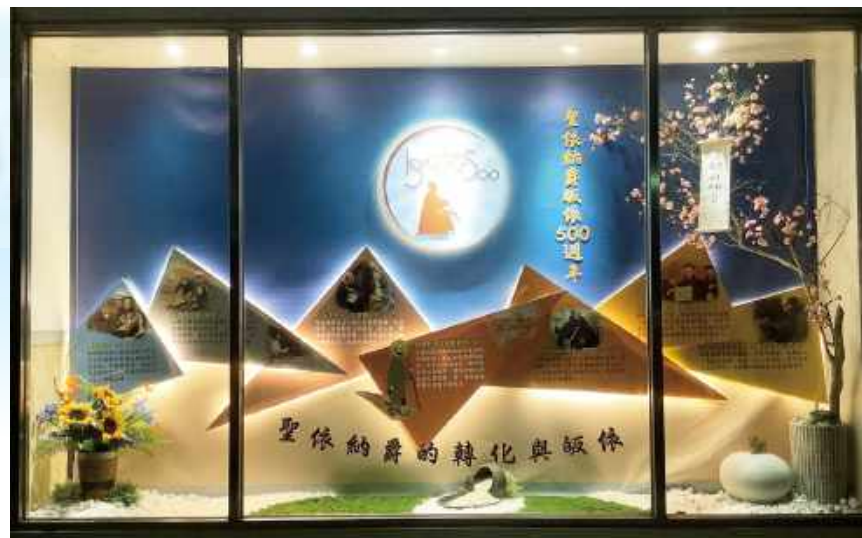
▲阮保利會士的櫺窗設計作品，詮釋對會祖聖依納爵歸依及轉化歷程的獨到美感。

現在當我回波蘭時，還是會去找他談話，每次和他見面，都會感受到自己無條件地被接納。阮：在耶穌會內、外，都有一些影響我的人，我不敢理想化任何人，只想感謝天主，因為祂藉由這些人的生活，給了我效法的榜樣，也透過一些不太正面的經驗，幫助我反省。從信德的角度來看，每個人都是天主送給我的禮物，讓我學會尊重他人的特色、能力和極限。他們就像許多「手指」，指向「太陽之光」(天主)的方向；所以，我對他們表示感激的方式，是仰望太陽之光為他們祈禱，而不是只關注手指。