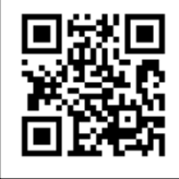
▲報名感恩祭與共融茶會