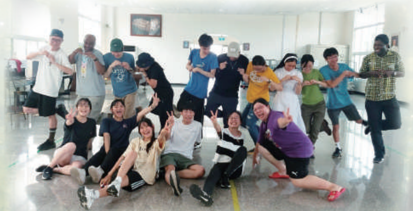
▲藉著世青，來自台灣各地方教會青年彼此開心共融，相偕同行。