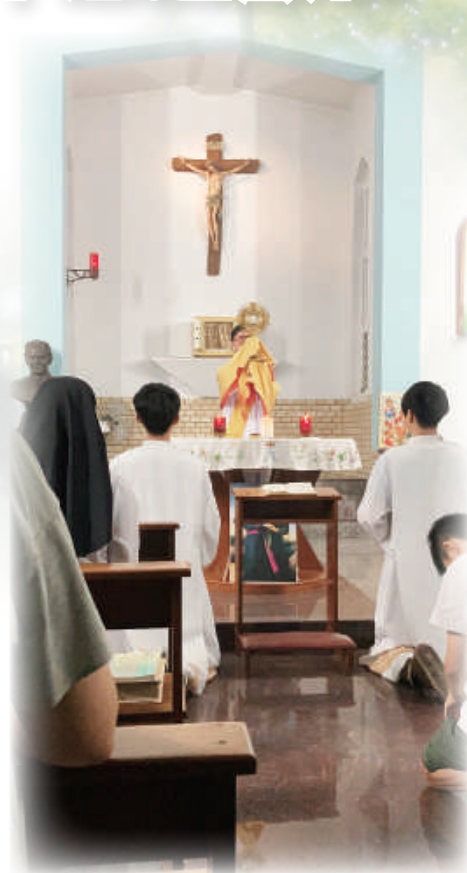
▲青年朝聖們敬拜聖體，求主賜予恩寵。