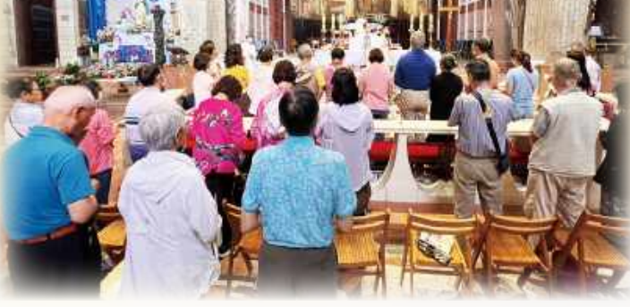
▲在聖地中的聖地，聖母領報大殿的彌撒，深深撼動朝聖者們，誓為基督作證，直達地極。