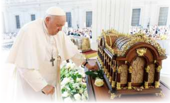
▲教宗方濟各6月7日在公開接見活動中，向聖女小德蘭聖髑祈禱後，前往傑梅利醫院進行手術治療。

阿爾菲里醫生明確表示，手術是由照顧教宗的醫療團隊計畫的，該團隊由教宗的私人醫生馬西米利亞諾·斯特拉佩蒂 (Massimiliano Strappetti) 醫生協調，經多方審慎評估，且在6月6日進行多切面電腦斷層掃描後，才決定進行這項手術。他強調，此次手術並不是一個緊