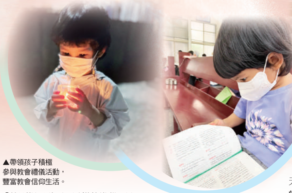
▲帶領孩子積極參與教會禮儀活動，豐富教會信仰生活。

幼兒的動作一向比成人慢，所以需要更多的時間準備，出門前要讓孩子有充分的時間整頓自己的身體與心靈，而不是感到家長的催促與不耐煩。其實，孩子和家長的感恩祭已經從這時開始了，正如主禮神父在準備感恩祭之前所進行的更衣祈禱，所以即使每位成員在家裡更換衣服準備去參禮的時刻，就已經是祈禱的契機；因此，