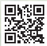
▲了解更多慈幼會台灣世青團