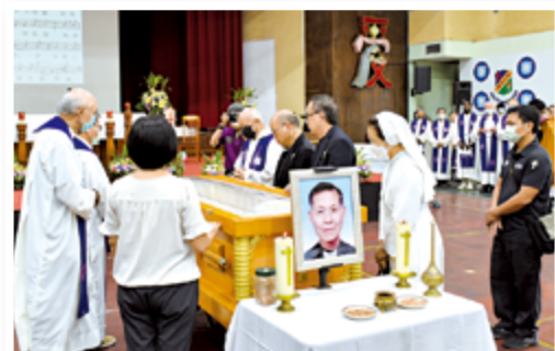
▲參禮代表們上前瞻仰遺容，深致悼念。

陳興翼神父一生致力於培育聖召，並肩負牧民救靈使命，這位充滿喜樂、愛青年、盡本分，熱心服務的慈幼會士，寄望遍撒福傳的種子，使華人教會欣欣向榮。今日中華地區的教會仍等待你我共同呵護灌溉，使福傳的種子萌芽茁壯，讓中華青年都得到更好照顧與服務，也讓聖鮑思高神父魂牽夢繫的福傳遍中國，如天主所應許終將成真。進教之佑，為我等祈！