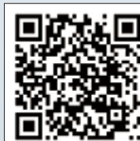
▲歡迎各堂區、修會及善會團體包場。

謝謝教宗方濟各，他始終在風雨飄搖中的世界處境奔波，關懷人類的問題及未來，表達了天主教會的立場與主張，並以行動傳達了天主無所不在的愛，及人類已經獲得救恩、救贖，但未圓滿的，「朝聖者」生命。