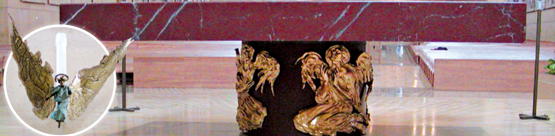
▲美國加州洛杉磯的天使之后主教座堂（Cathedral of Our Lady of the Angels）的祭台及燭台，以充滿藝術氣息之各種當代天使樣貌來裝飾，令人嘆為觀止。

■文·圖片提供／錢玲珠（輔仁聖博敏神學院禮儀研究中心創立人、台北總教區禮儀委員會聖藝組召集人）