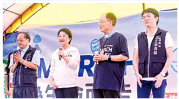
▲台中市盧秀燕市長(左二)蒞臨致詞，對遊行活動表示肯定，並感謝天主教會熱心公益不遺餘力。

台中市盧秀燕市長也特地來到光復國小外操場和大家歡聚，她表示：「一定要支持教區舉辦『MARCH for LIFE·為生命而走』這個重要的遊行活動，也感謝天主教會所有聖職好友、教友弟兄姊妹，在蘇主教的領導之下，長期在各個崗位上為台中市的發展而努力，經常為市政及市民祈禱，並為市府團隊祈禱，令我十分感動！感謝大家的祈禱與祝福，我都有收到。祝福天主教會教務昌隆，我們的國家國泰民安，所有市民身心靈平安快樂！」(文轉2版)