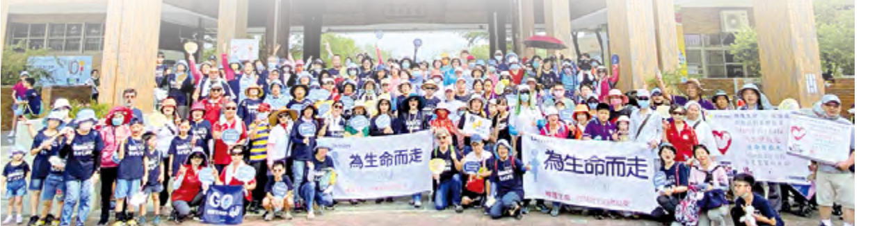
▲嘉義教區許多家庭扶老攜幼參與「MARCH for LIFE·為生命而走」遊行活動，不分男女老少致力為弱小生命發聲。