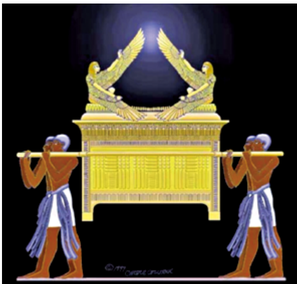
▲ (圖10) 《出谷紀》描繪上主的約櫃製作方式，特別提及革魯賓天使以萬軍之姿，鎮坐在約櫃之上護守。

天主在愛中創造了人類，並在每一個生命的開始，就派遣一位天神照顧、護守，直至生命的結束終結，稱為「護守天神」。「上主必為你委派自己的天使，在你行走的每條道路上保