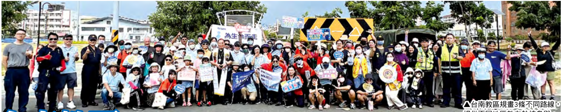
▲台南教區規畫3條不同路線，提供不同地區教友熱情參與。