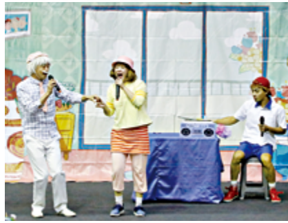
▲《我愛阿嬤妮》舞台劇全國公益獻演，宣導失智症的預防及延緩。

天主教失智老人基金會響應9月「國際失智症月」，分別與新竹市衛生局、南投縣衛生福利部草屯療養院合作，在新竹市與南投縣舉行《我愛阿嬤妮》失智症公益舞台劇演出，推動民眾認識與預防失智症、健康生活型態、失智友善等議題，共創失智友善社會。