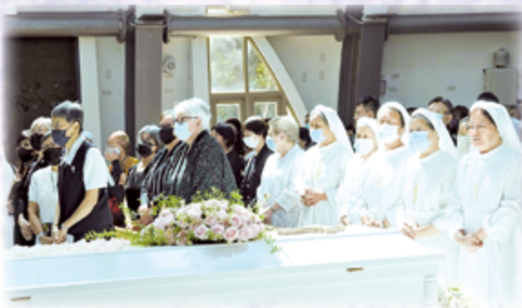
▲眾修會修女們齊至參禮，姊妹情深不言可喻。