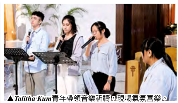
▲Talitha Kum青年帶領音樂祈禱，現場氣氛喜樂。

最後，Talitha Kum青年團以美妙的歌聲唱出〈為生命祈禱文〉、〈上主的祝福〉，祈求天主廣施恩寵，讓眾人持續為維護生命作見證，使更多人重視生命的尊嚴，世間遍傳福音真理。