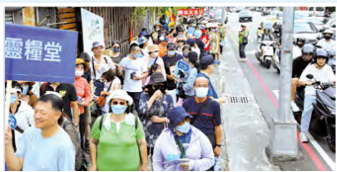
▲遊行隊伍把握時機，向騎士宣導「MARCH for LIFE」意義。 ▲贊同尊重生命理念的同行者，一起比讚，相約再為生命而走。