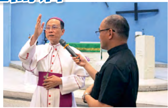
▲鍾安住總主教在遊行活動前，為參與眾人降福。