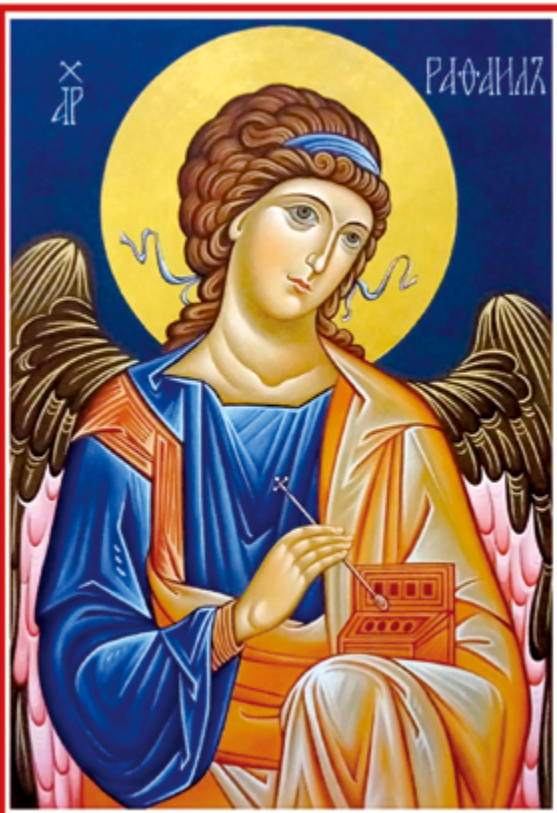
▲（圖6）台北聖像畫師王雲裳所寫聖來福聖像，天使手持藥盒及十字架形的藥匙，象徵他的醫治使命。

初期教會對佳播天使並沒有特別的敬禮，他的紀念日始於第10世紀，直至1921年，教宗本篤十五世時，才普及整個教會。