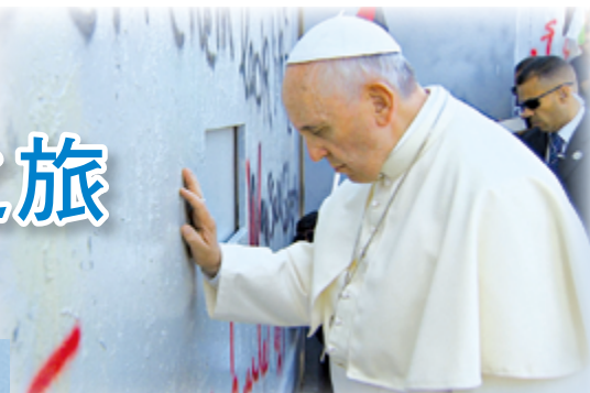
▲教宗方濟各為各地戰事祈求天主恩賜和平

教宗尤其對弱勢族群，更是表達深刻的關懷，並給予鼓勵。因為我們有同樣的信仰，我們相信聖神在每個人身上的臨在並運作，因聖神恩寵的啟發與帶領，協助我們與天主聖三的奧秘生命相遇。我們相信天父無限、寬恕的