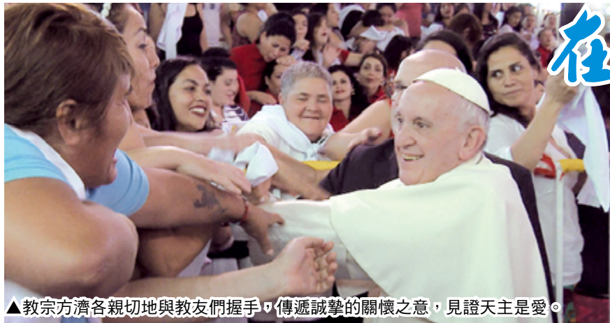
▲教宗方濟各親切地與教友們握手，傳遞誠摯的關懷之意，見證天主是愛。

今天是教師節。耶穌曾經叫我們不要稱地上的人為「教師」（參閱瑪23：8），那祂不要我們慶祝這個教師節嗎？當然不是！但是祂確實要求所有真正的教師應該教導祂所教導的，否則不配被稱為「教師」。真正的教師會教導我們：日後在天主審判台前，怎樣保持良心的平安，可以向天主交帳。