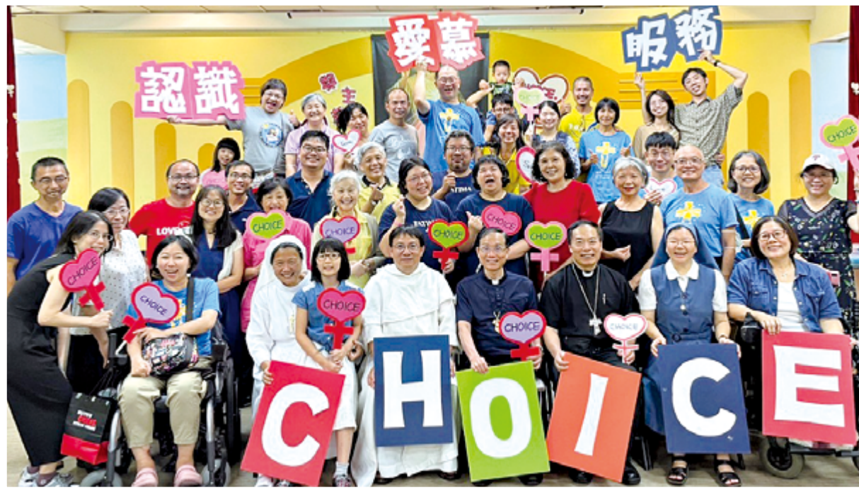
▲CHOICE選擇成長會來台創立35周年，陪伴眾多青年教友在信仰中的成長，福傳成果斐然。