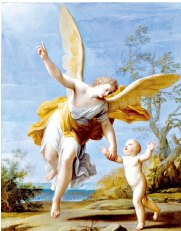
▲ (圖11) 護守天使帶領我們常保一顆赤子之心，不離天主，在我們所走的每條路上守護我們。

《出谷紀》的第23章20至23節中，上主這樣說：「看我在你面前派遣我的使者，為在路上保護你，領你到我所準備地方。在他面前應謹慎，聽他的話，不可違背他，不然他絕不赦免你們的過犯，因為在他身上有我的名號。如果你聽從他的話，做我所吩咐的一切，我要以你的仇人為仇，以你的敵人為敵，我的使者將走在你前……。」可以看出，天使在保護之外，