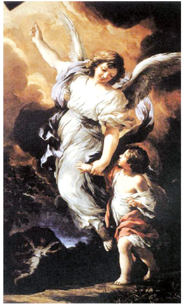
▲ (圖12) 護守天使一生都陪伴、照顧、引領我們。