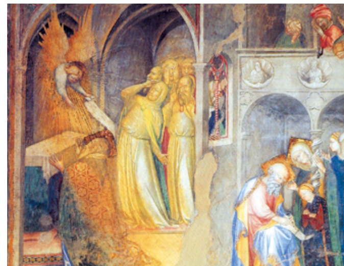
▲（圖4）佳播天使顯現給厄加利亞，告知他將喜獲麟兒。 ▼（圖5）1150年的許瓦本福音書中，佳播天使向聖母報喜。