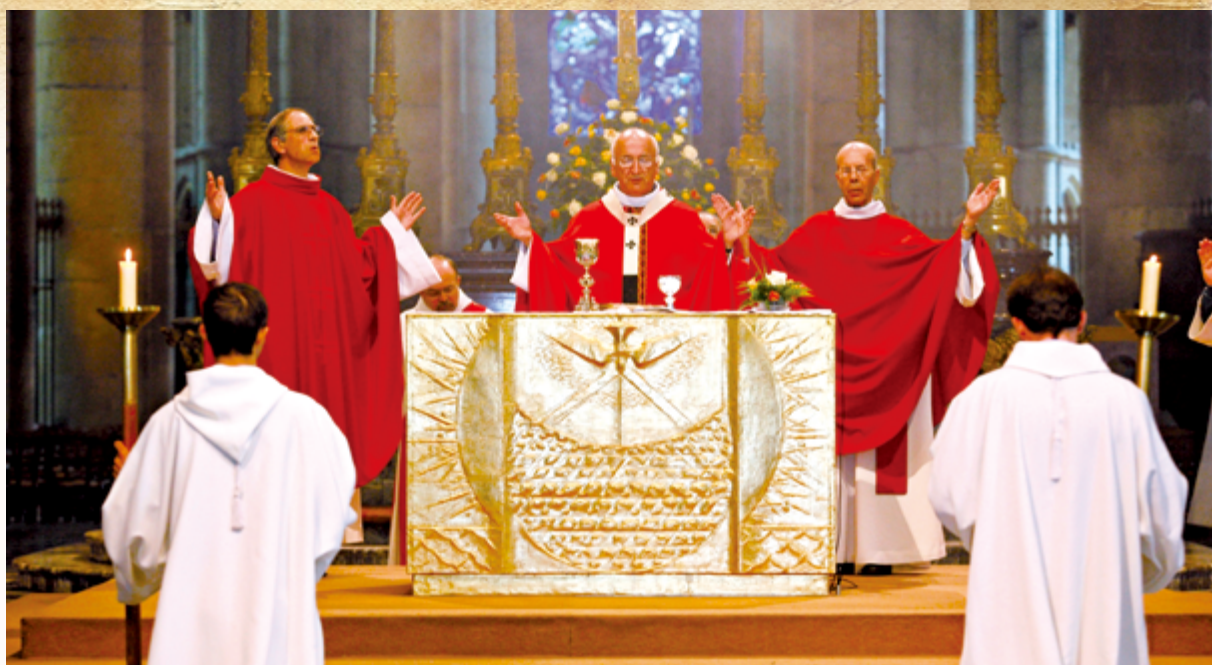
▲領聖體禮以恭念〈天主經〉為始，準備領受主賜的精神食糧。

金言聖伯多祿說，「意識到自己身為奴僕的境況，本應使我們覺得該鑽入地下，身處的塵世也該化為塵埃，但我們天父的權威和祂聖子之神，催迫我們喊說：『阿爸，父啊！』（羅8：15）除非人心深處受到來自上天德能的推動，一個軟弱有死的人，何時才敢稱天主為父呢？」（《講道集》71：3）。卑賤灰土、罪大惡極的我們，怎能敢稱天主為「父」呢？必須遵