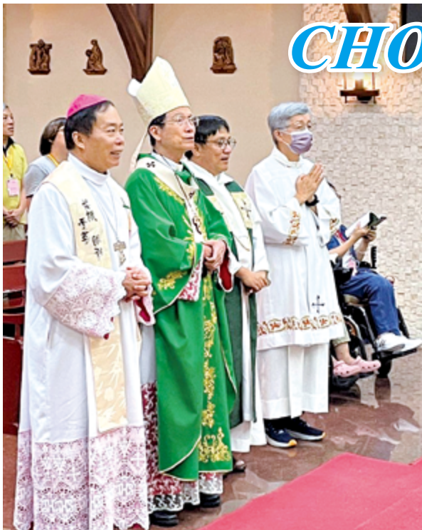
▲CHOICE選擇成長會在神長們的陪伴下，益發茁壯。