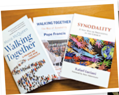
▲接受培育時，需閱讀的書籍。 ▶培訓上課中，每人專注學習。