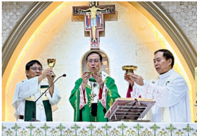
▲選擇成長營共融活動感恩聖祭，由鍾安住總主教禮（中），黃敏正主教（右）、何萬福神父共祭。

當 我聽到黃敏正主教這段分享：「今天早上我來參加這個活動的心情，就好像回到『家』一樣！」這讓我不禁想起舉辦這一場活動的初衷。