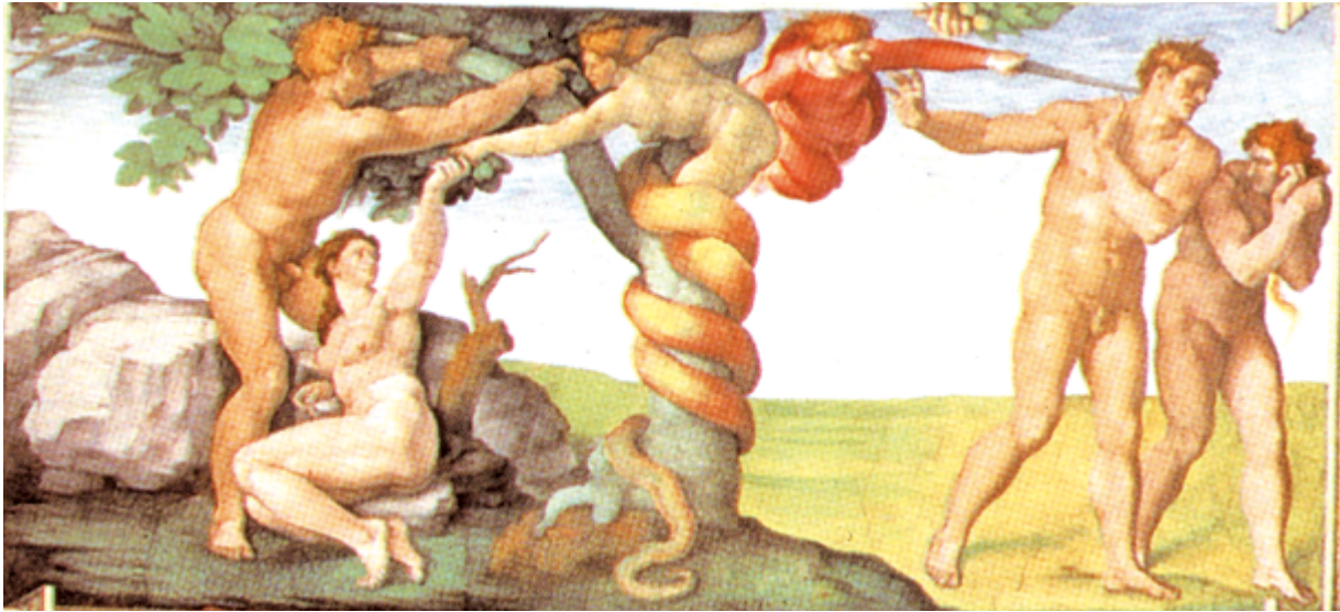
▲ (圖9) 西斯汀聖堂穹頂米開朗基羅氣勢磅礴的濕壁畫，描繪革魯賓奉上主之命，將原祖父母逐出伊甸園。