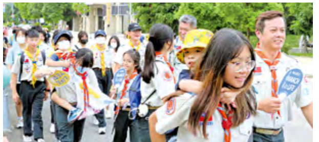
▲磐石中學與桃園聖母聖心堂的童軍團，展現互助友愛情誼。

感謝服務的頭份天上之母堂、卓蘭聖伯多祿堂、北苗玫瑰天主堂、公館聖保祿天主堂、造橋聖嬰堂、後龍聖母無原罪堂，更感謝所有參與活動者。「MARCH for LIFE」並非一個口號或一日活動，而是時時刻刻珍愛每一個生命！