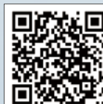
▲歡迎觀賞《在旅途中》精彩預告片