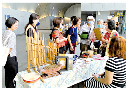
▲民眾對異國文化攤位，感到高度興趣。

參觀畫展的民眾分享，平常對移工沒有太多接觸，直到家人有聘雇看護的需求，才進而認識到移工朋友，然而，移工問題卻鮮少被討論；這日最有趣的環節是闖關活動，娛樂同時又能了解各國不同文化，交流後，深感移工與我們沒有不同，且很快就聊開來，祝福移工們在台灣一切順利。