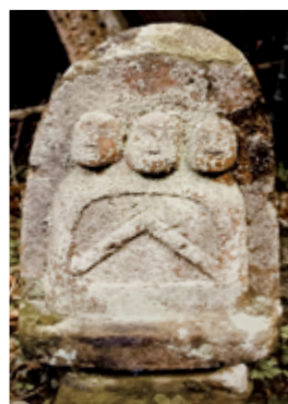
▲巍立的沙勿略登岸紀念碑 ▲紙踏繪原件，盡訴教難血淚。 ▲開教時期的壓麵餅機 ▲在地化的三位一體天主石雕