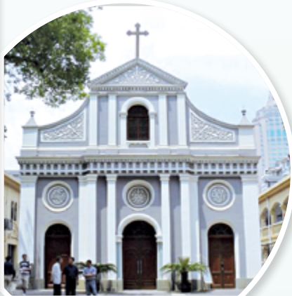
▲▲杭州聖母無原罪主教座堂建築造型典雅，祭台後方壁畫精緻且寓意深刻。