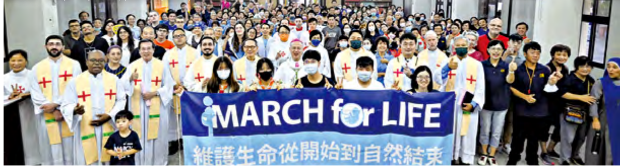
▲新竹教區規畫於「MARCH for LIFE·為生命而走」遊行活動後舉行彌撒聖祭，為生命的美好獻上讚頌及感恩。