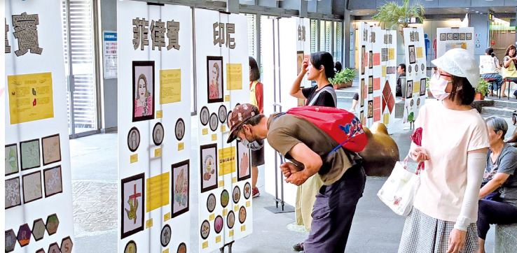
▲民眾認真欣賞國際移工禪繞畫展創作，認識移工內心世界。 ◀新事社會服務中心同仁與參與畫展移工朋友們，溫馨比愛心合照。

新事社會服務中心自2019年起，每年舉辦國際移工禪繞畫展，受到各界肯定，今年9月10日在大安森林公園捷運站，熱烈展出第5屆以「走入移工世界：故鄉·新家鄉」為主題的禪繞畫展，希望拉近民眾與移工之間的距離，彼此不再只是陌生人。