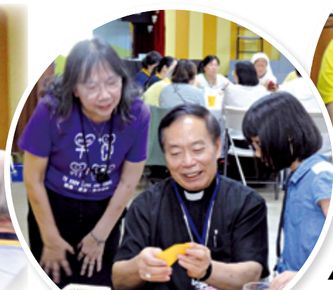
▲鍾安住總主教（右）與CHOICE的家庭成員互動。