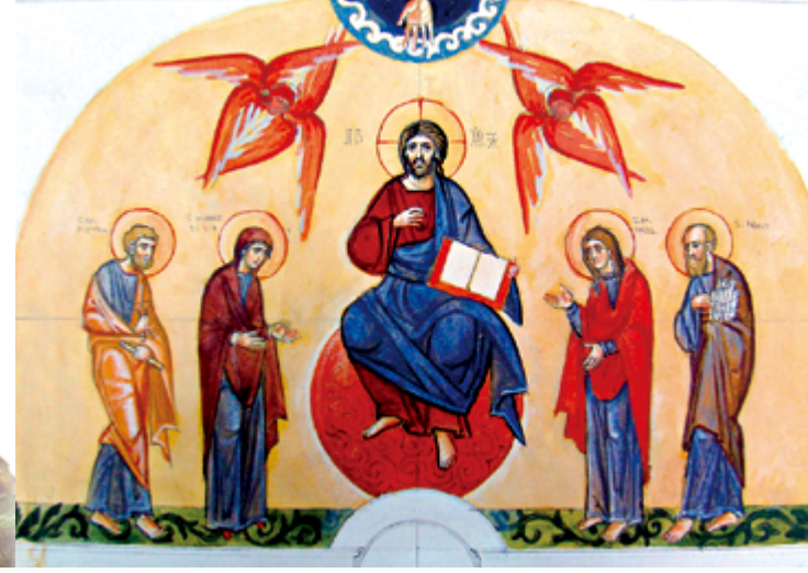
▲（圖8）台北樹林耶穌聖心堂壁畫，色辣芬天使隨侍在基督的兩側。

雖然在《新約》中並沒有提及色辣芬，但在《默示錄》若望的神視中，卻有類似的描述。上主正坐在寶座上，在寶座周圍，有四個活物：「那四個活物，個個都有六個翅膀，周圍內外都滿了眼睛，日夜不停地說：『聖！聖！聖！上主，全能的天主，是昔在、今在及將來永在者。』」（默4：8）（文轉14版）