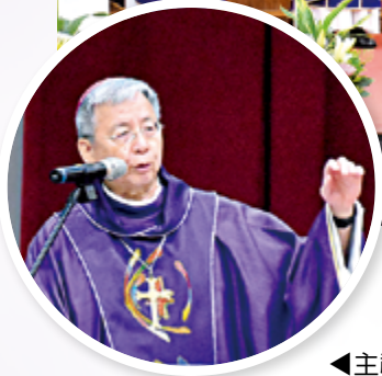
◀主禮韓大輝總主教於講道中，回憶與陳興翼神父如師如父的真摯深厚情誼，感動人心。

妥善照顧，憑藉堅毅的信德與復健求生的毅力康復如昔。3年後，還遠赴教廷，參禮小他6個月的同窗陳日君神父榮陞樞機大典。今年8月19日阮國選與陳天福執事晉鐸，他亦風塵僕僕北上參與共祭，愛護晚輩的心，讓兩位新鐸自越南省親行程專程回台，參加恩師殯葬彌撒。