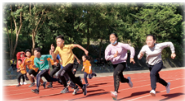
▲運動大會上,青年選手恣意揮灑汗水,直奔標竿,以生命力見證上主的無限慈愛。

彌撒聖祭禮成後,展開熱鬧的運動比賽,精彩紛呈,展現原住民教友們的熱情與生命力,現場洋溢著喜悅,全體滿懷感恩的心,謹記主耶穌的教誨,自我期許幫助更多的人。