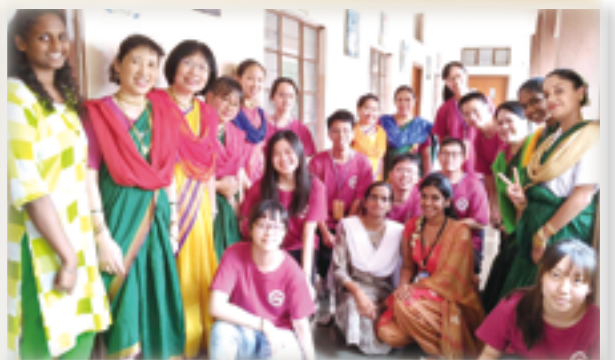
▲聖德蘭文教團赴印度分享天主的愛，融入當地文化與教育，留下多彩多姿的喜樂回憶。