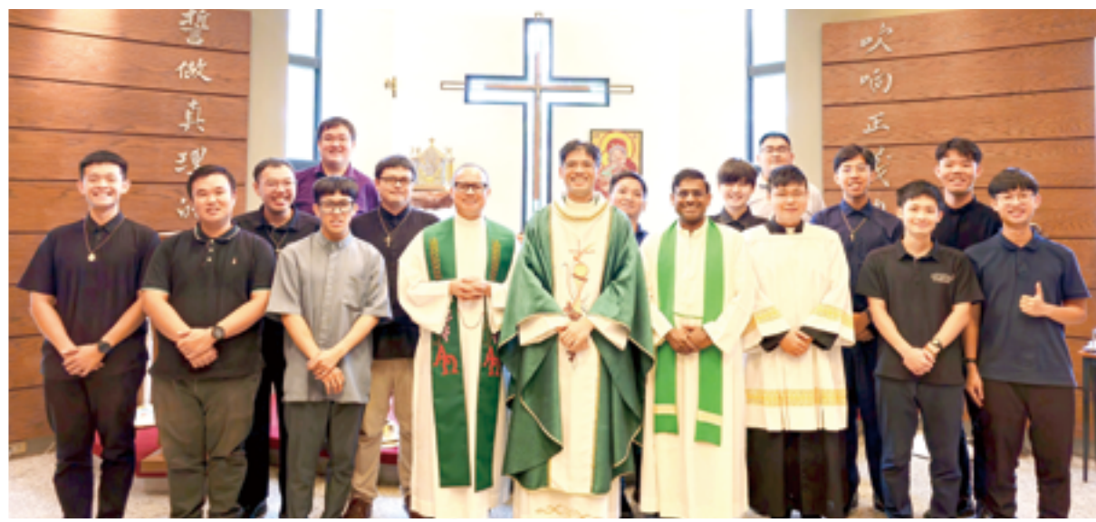
▲向人宣揚福音及分施天主恩寵，是司鐸聖召的神聖使命。

再者，基於信友們對洗禮的認識及天主對人其計畫的認識作為基礎，在談論「司鐸聖召」的推廣上，才顯出力道。因為，唯有信友們真正意識到天主對自己是計畫的，才觸發人