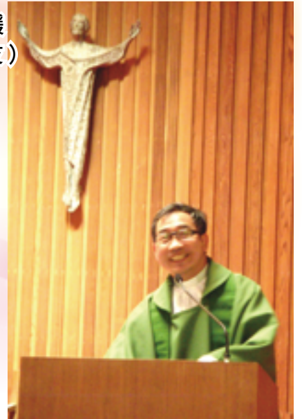
▲胡國楨神父2010年在北美聖荷西共融營彌撒講道，闡揚信仰與文化的關係。

讀完《播種的公務司祭》一書，觸發我對信仰的一些理解和感想，也為胡國楨神父對基督信仰在地化的努力感到敬佩！