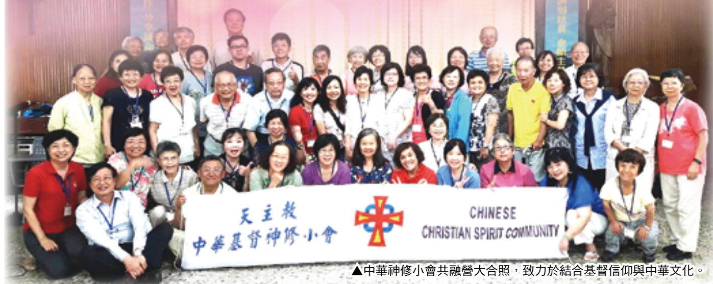
▲中華神修小會共融營大合照，致力於結合基督信仰與中華文化。