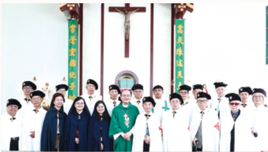
▲蘇耀文主教（前排中）與耶路撒冷聖墓騎士團台中分會騎士們歡聚，分享信仰見證。

在熱心、敬禮、朝聖，卻對世界的呼喊充耳不聞，不是真正的信仰體驗，這個不是真的信仰，我們必須與社會上窮苦的人相遇，和耶穌基督一樣，為愛這些軟弱、有需要的人服務，才是真正愛天主和愛近人的信仰生活。」信仰耶穌基督，就是要跟隨祂的腳步，聖神將帶領我們成聖，我們要如同聖母不畏艱苦、不怕犧牲，將一切獻予天主，活出真正的信仰見證生活，天主會賜予我們無限的恩寵。」