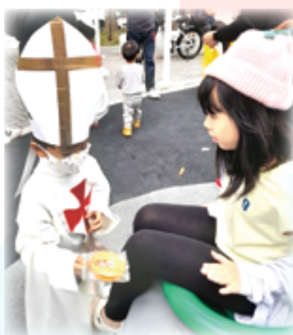
▲扮演教宗的孩子，在公園發送祝福餅乾給小姊姊，傳遞「天主教是愛」。