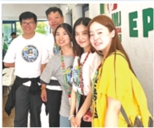
▲同學們參與世界青年日，豐富信仰生命。