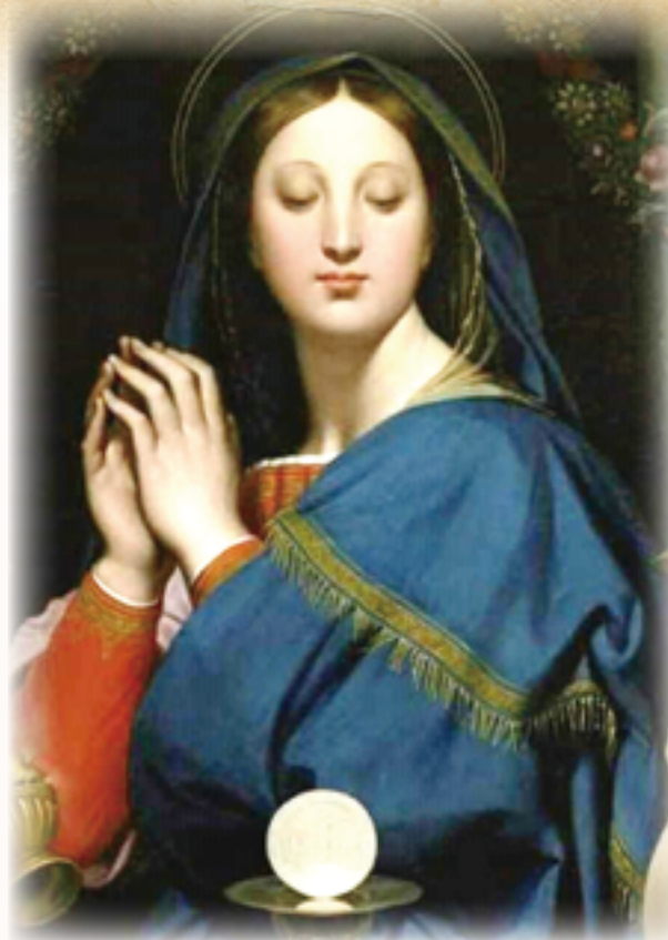
▲聖母瑪利亞參與天主的救贖計畫，是最完善的聖體櫃。

天父願意將一切恩寵的泉源——耶穌基督，藉著聖母瑪利亞才給了世界。如此，在耶穌基督之下，聖母瑪利亞成為所有恩寵的管理人，如同一個管道和橋樑，將自泉源湧出的恩寵分受於每一個心田中。尤其在彌撒聖祭中，作為聖教會的最超凡成員，聖母瑪利亞就被天主特選擔任這一切恩寵的媒介。教宗聖若望保祿二世說：「當我們舉行彌撒聖祭時，天主子的母