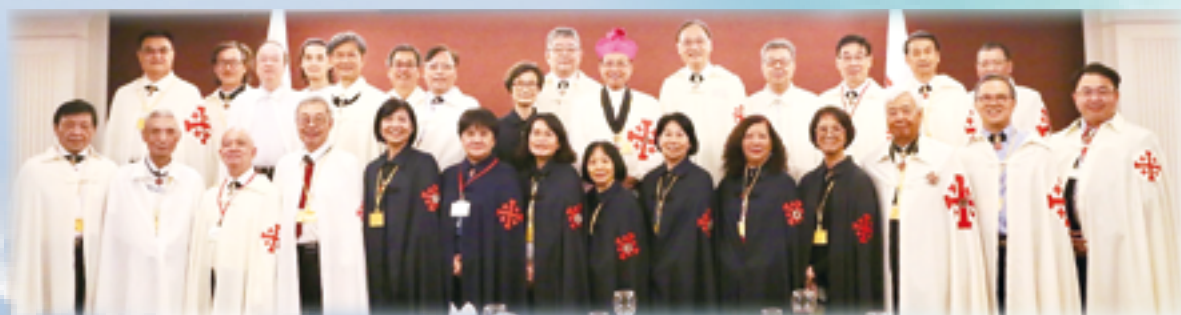
▲鍾安住總主教（後排右六）勉勵騎士們，要以祈禱、愛德來傳揚基督福音，重振教會。 ▲教宗接見耶路撒冷聖墓騎士團成員，提出培育指導方針，祈求分擔耶路撒冷的巨大痛苦，恩賜和平。