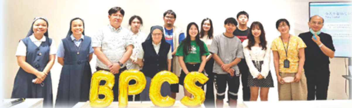
▲天主教研修學士學位學程的同學們，修讀天主教自媒體製作專題課程，期末發表，表現優異。

二、 天學學程的存在價值及對教會的重要性 ：天學為何要在輔大成立？我們想一想：福傳的工作到底是什麼？福傳不是只在堂區而已，各個教會機構都可以進行福傳的工作，但是，僅是如此嗎？所謂的福傳園地，只要是非教友的場所，都是我們要傳教的地方，難道只有進到堂區來的人，才給他們分享天主的聖言