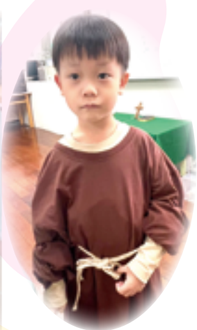
▲小寶貝扮演亞西西的聖方濟，有模有樣。