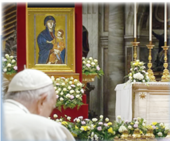
▲教宗方濟各懇求全世界人民給予加薩居民人道關懷與援助。