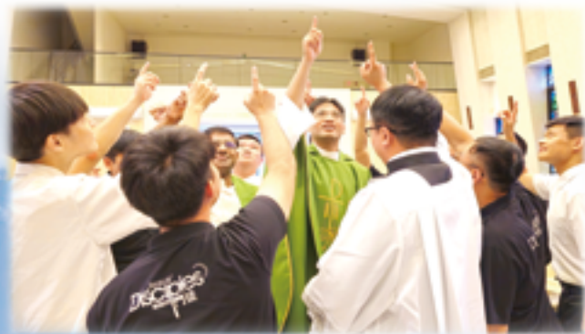
▲聖召是來自天主對人的召叫，更需要人積極地答覆。

因 著認識洗禮所賦予的身分，以及隨之而生的使命與責任，也就是天主對人的召叫。其實，天主對我們每一個人都有一個召叫，這就是我們所說的「廣義聖召」，換句話說，就是天主對人「神聖的召喚」，以及與之相隨的「人的答覆」。