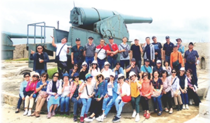
▲感謝天主聖神引領，萬金聖母聖殿聖詠團澎湖之旅順利圓滿，參與者皆豐收。