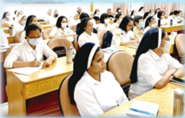
▲高雄場次中，不同國籍的各修會男女會士踴躍出席研習。

施神父鼓勵，無論是個人還是修會團體，都要敞開心扉彼此了解，這意味著要踏上一條轉型及歸依的道路，同時也是一條邁向神性的道路。