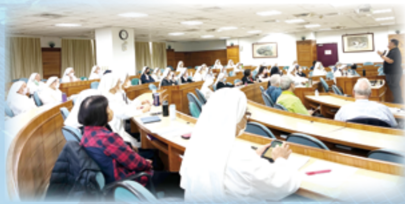
▲今年培育研習增加台中場次，顯示許多人對跨文化議題的格外關注。