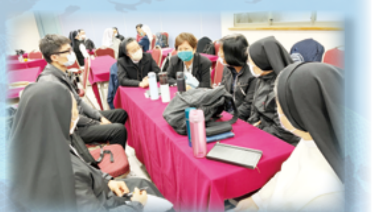
▲男女修會會長聯合會今年的培育研習台北場中，與會者交流熱絡，分享各自在信仰中的跨文化生活及福傳切身經驗。

灣一些國籍修會為求生存，便從越南等地尋找聖召，因而衍生多元文化的問題。如何在跨文化與本地化之間尋得平衡，成為當今教會必須面對的挑戰。