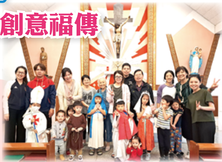
▲通化街聖玫瑰堂主日學的孩子們扮演聖人，歡慶諸聖節。

「祝你平安！」孩子純真的童稚嗓音搭配獨一無二的可愛裝扮，路上的行人紛紛行以注目禮，也忍不住勾起唇角由衷微笑，輕輕柔柔回答小朋友：「謝謝你喔！」有坐在草叢邊講電話的女生嚇到整個跳起來，看清楚是可愛孩