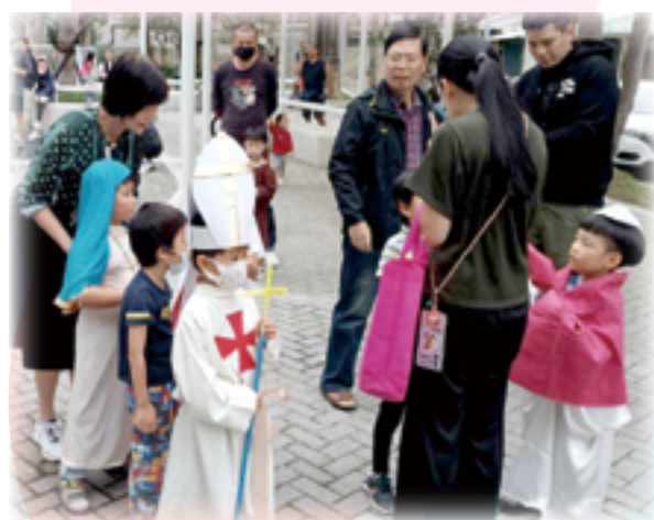
▲扮演聖人的孩子們到教堂附近的公園展開福傳，吸引路人的眼光，與可愛的小天使們喜樂互動。

期待明年有教會幼兒園或更多主日學加入可愛行列，好好的孩子幹嘛要教他們搗蛋呢？看，愛天主的孩子多可愛！