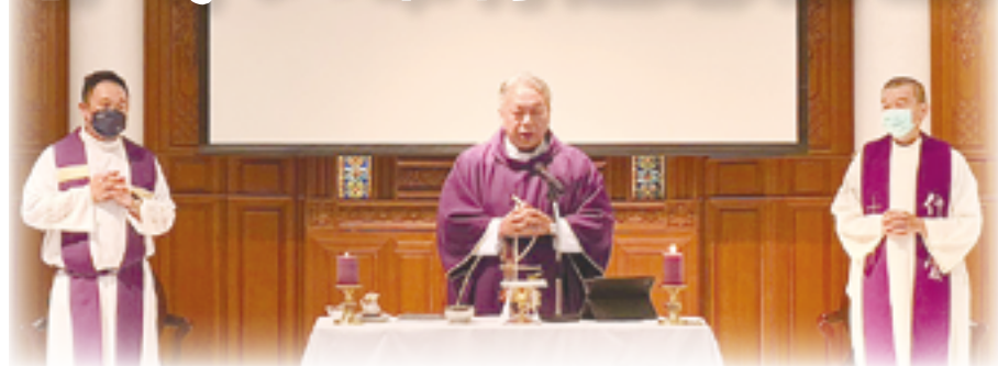
▲金寶山舉行追思已亡感恩聖祭，由黃斯勝神父（中）主祭，孫志青副主教（右）及楊阜鎮神父共祭，眾多信友及家屬參禮，向已亡親友及恩人共表追思心意。

每年11月是天主教會的追思亡者月，金寶山墓園於11月11日上午10時30分在日光苑舉行追思已亡感恩聖祭，由台北總教區聖母無原罪主教座堂主任司鐸黃斯勝神父主祭，孫志青副主教及楊阜鎮神父共祭，當日雖然飄著細雨，仍有滿座親友、修女及主內弟兄姊妹們虔敬參禮。