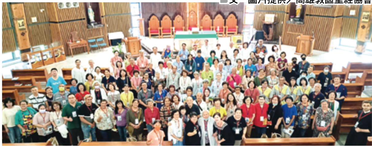
▲第20屆全國聖經研習共融營在高雄真福山社福文教中心舉行，各教區神長及信友逾百人共襄盛舉。

稍事休息後，與會者們以「世界咖啡館」的方式進行分組討論，題目含括「個人及團體讀經」、「真福八端的省思與挑戰」，以及「如何在生活中實踐」3個幅度。各組成員雖來自各