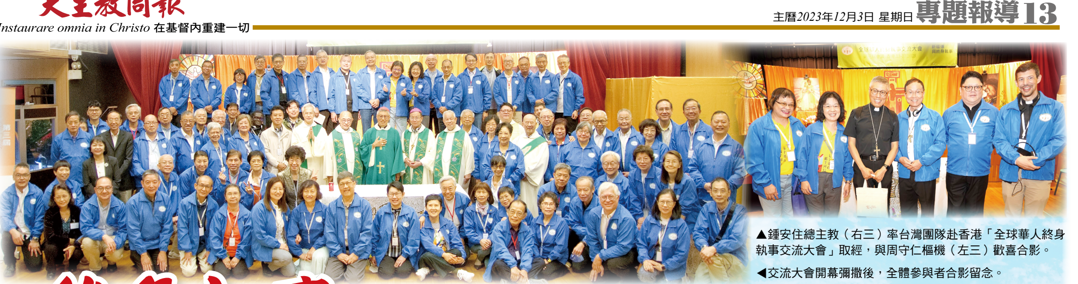
▲鍾安住總主教(右三)率台灣團隊赴香港「全球華人終身執事交流大會」取經, 與周守仁樞機(左三)歡喜合影。