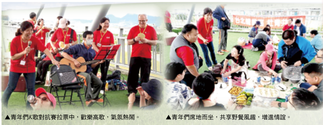
▲青年們K歌對抗賽拉票中，歡樂高歌，氣氛熱鬧。