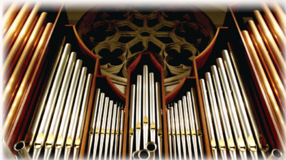
▲音樂是禮儀的必要或組成要素，而且需要達到盡善盡美的標準。

然而「知道」總是會帶來更深的渴望，渴望越來越懂得如何正確地詠唱。以上這些問題既是聖樂的問題，也因為是禮儀中的音樂，因此，這些問題更是禮儀學的問題，爰此，我願意嘗試從禮儀學的層面來面對及回應以上的提問。