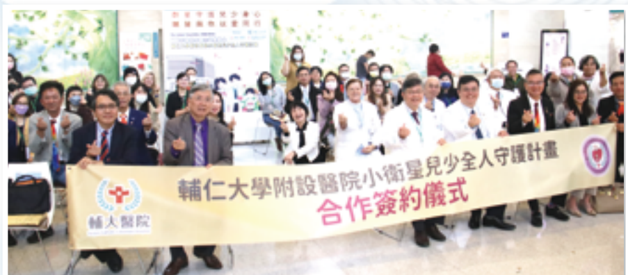
▲輔大醫院團隊與小衛星合作單位完成合作簽約儀式，合影誌念。