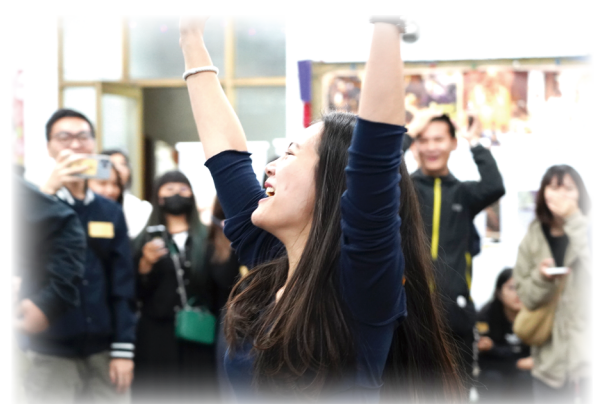
▲青年在遊戲中開心交流，享受主內共融美好時光。