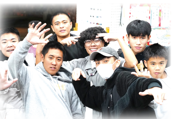
▲青年結伴同行，讓人看見教會充滿朝氣及希望。