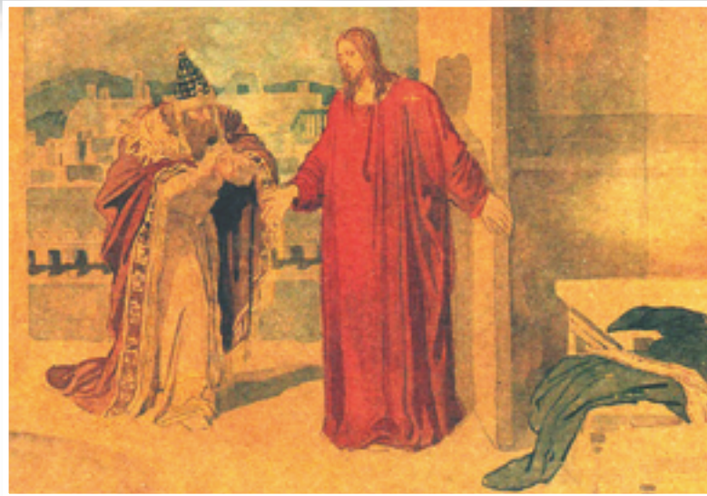
▲尼苛德摩夜訪耶穌，獲得「重生」的喜訊，啟迪後人對老年使命的省思。

神話，對不朽的身體極之著迷，老年在很多方面是受輕視的。因為它承載著那個無可否認的證據，證明這個神話的終結，那個神話希望我們回到母親的腹中，帶著一個永遠年輕的身體再度回來。