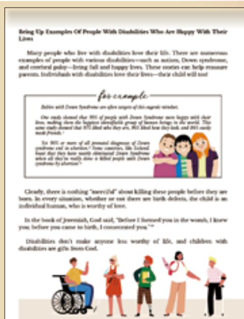
▲《為什麼我們不需要墮胎》中英對照，使人更易於閱讀。

「人的生命，自受孕的開始，就應該絕對的受到尊重和保護。」（《天主教教理》2270）當輕易捨棄一個生命時，也就沒有機會看到新生命帶來的希望與美好！他可能是我們的家人、手足或朋友，與我們的生命連結。當胎兒被扼殺在子宮內的同時，也等於我們之中有人也失去了親情、友情甚至是愛情。我們有責任守護每一個弱小的生命，並為他們發聲。