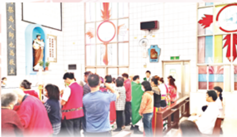
▲新屋堂福傳音樂會適逢重陽節，司鐸特地為長者及病友傳油，共享主恩。

聖吉安娜生命維護中心很榮幸受邀參加新屋耶穌聖心堂舉辦的「秋季動感才藝大賞」活動，讓中心有機會向大家介紹中心的服事及義賣愛心編織團的手工織品。短短兩小時，節目精彩豐富，毫無冷場，表演團體來自各處，還有遠從高雄來的專業手語舞蹈表演！我們義賣擺攤之餘，充分感受到表演團體的熱情演出，也隨之手舞足蹈，尤其是原住民團的慶祝舞蹈，大家手拉手圍成一大圈一起跳舞，全場嗨到最高點！新屋耶穌聖心堂的能量讓人驚艷，