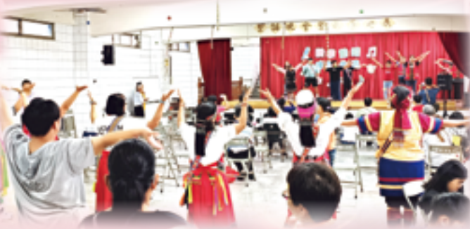
▲新屋原住民委員會夥伴們載歌載舞，炒熱現場氣氛。