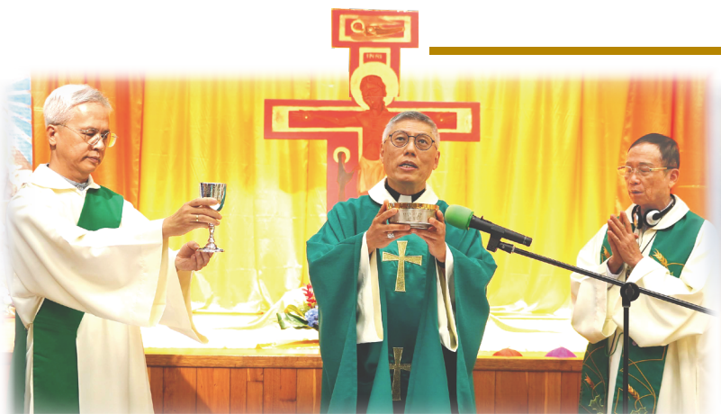
▲開幕彌撒由周守仁樞機(中)主禮, 鍾安住總主教(右)共祭, 陳樂宏終身執事襄禮。