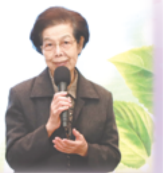
▲總統府張博雅資政致詞，表達由衷感謝與祝賀。