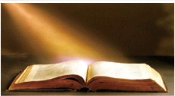
▲聖經是禮儀詠唱的根源，禮儀詠唱是聖言的讚美。