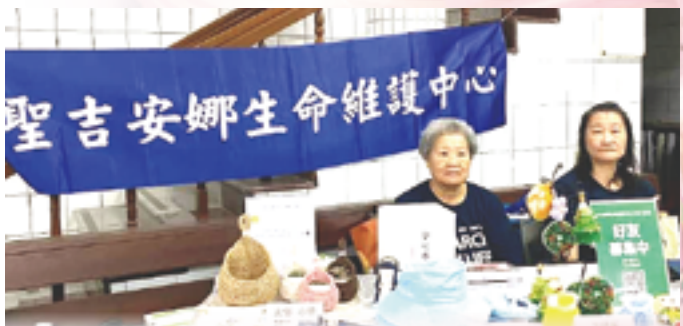
▲聖吉安娜生命維護中心擺攤義賣，共襄盛舉。

非常感謝各團體跟表演者的大力相助，今年還有泰澤祈禱和聖誕點燈活動，希望能夠把這份愛傳到附近社區鄰里，與非教友有更多連結，今年很快要過去了，祈求天主能為我們多添點柴火，多澆點猛油，點燃心火，讓我們一起繼續向前進！