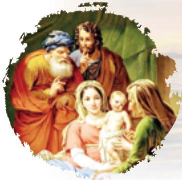
世界祖父母及長者日 2023教宗教理講座 1