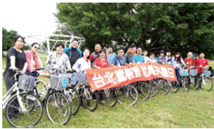
▲青年在河濱騎單車，享受愉快共融，度過美好的一天。

為了讓大家認識彼此，友誼教友中心準備的破冰遊戲很精彩，幾輪遊戲玩下來，可以幫助人簡單記住大家的名字。特別的是午餐時間的歌唱PK，另一組的歌喉非常優美，歌詞也都熟記，令人汗顏！當然我們這組表現得也不差，帶動唱的動作簡單明瞭，可以立刻上手，大家現場的默契配合得很好。