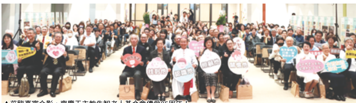
▲蒞臨嘉賓合影，齊慶天主教失智老人基金會傳愛25周年！