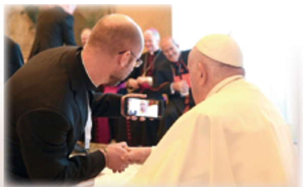
▲駐校司鐸與教宗方濟各欣喜合影，紀念會議成果。

教宗指出，教育工作者最糟糕的情況，是不去冒險。不冒險就不會有收穫，這是一條不變的鐵則。當一個心靈在掙扎中，萌生一項決定來創造某些新事物，抗拒一種過於算計的意識惰性，這就是勇氣。勇氣不喜愛華而不實的事物，包括理性和情感上的，而是看準必要的事物，放棄其他的一切。聖神——教會中「偉大的隱藏者」，祂賜予我們力量和勇氣，我們特別需要祈求聖神賜給我們這種勇氣。