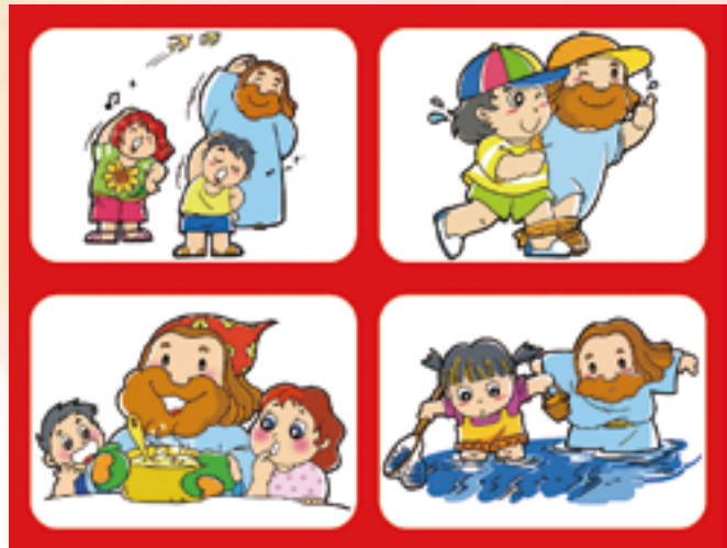
▲著色後示意圖，讓小朋友發揮創意自由塗上繽紛色彩，享受著色的樂趣。

16. 幸福列車 ：分享的快樂能加倍，我們和耶穌一起搭乘火車，到各處散播歡樂與幸福。