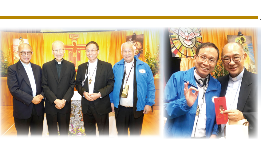
▲左起: 陳志明神父、湯漢榮樞機主教、鍾安住總主教(左)向香港安住總主教、澳門教區劉炎新神父在大會喜相逢, 共同為推廣終身執事職交流經驗。