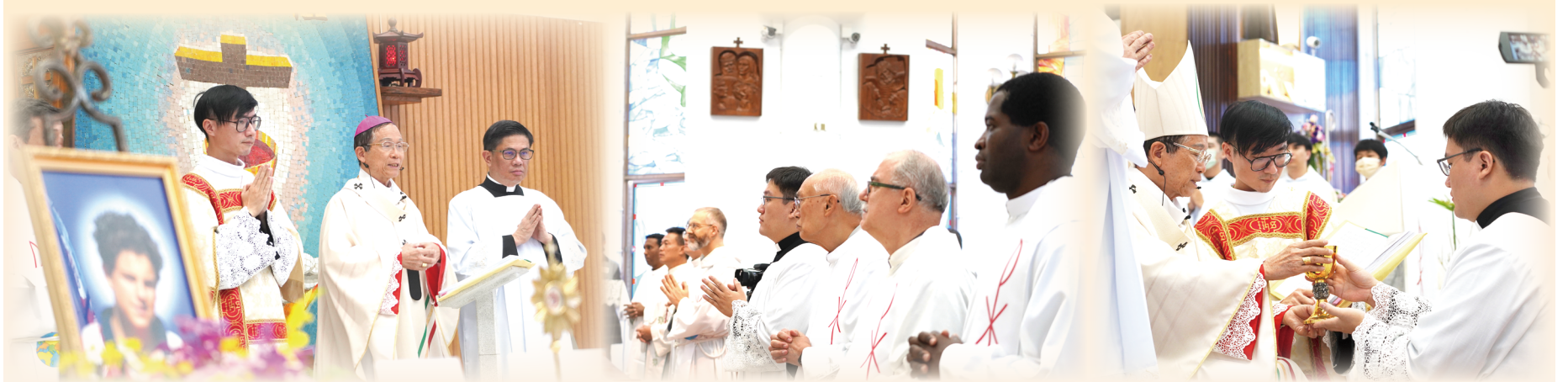
▲台北總教區舉行教區級青年日慶典，以青年真福卡洛·阿庫蒂斯瞻禮彌撒揭幕，由教區大家長鍾安住總主教（右二）主禮。