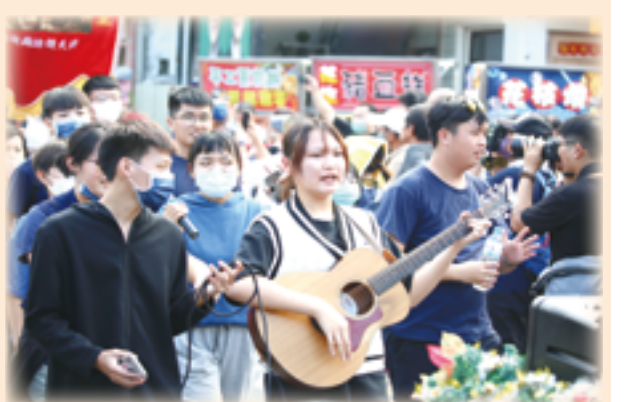
▲遊行隊伍中，青年們歡唱詩歌，喜樂讚頌主恩。

隊伍返回萬金聖母聖殿後，舉行隆重聖體降福禮，由劉總主教高舉聖體光步入廣場，數千名參禮者虔誠地跪地迎接，愛慕聖體至深，令人動容。此次慶典讓參禮群眾恩寵滿滿，在喜獲全大赦和聖體降福後，滿心喜悅地賦歸。