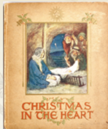
▲《心中的聖誕節》小書裡有文字與插圖，是1940年代相當受歡迎的聖誕禮物。

聖誕節歌曲此起彼落，「叮叮噹，叮叮噹，鈴聲多響亮」，在12月這個感恩又歡樂的月份，位於新北市永和區的世界宗教博物館，即日起至明年5月5日，在6樓生命之旅廳「消失的密室」，推出《文物開窗：基督宗教裡的新生和福音》特展，分兩個檔次，分批展出館內珍藏的7件基督宗教文物，參觀者可細品基督教藝術的光華，並深入了解宗教藝術的意涵。