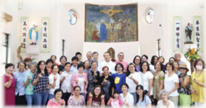
▲今年玫瑰聖母月，全部團員和朋友一起前往斗六聖玫瑰堂朝聖。

「行動！只有行動能為你作證，以最有力的言詞為你辯護。」「祈禱是我們唯一的力量。」聖鮑維達神父的訓勉，提醒團員們努力秉持這堅持奮鬥的精神，這一切都是我們可以學習的方向，或許我們的力量微薄，但是無論如何，只要我們願意做，切實去做，相信都會有所成效，讓我們繼續努力向前行。