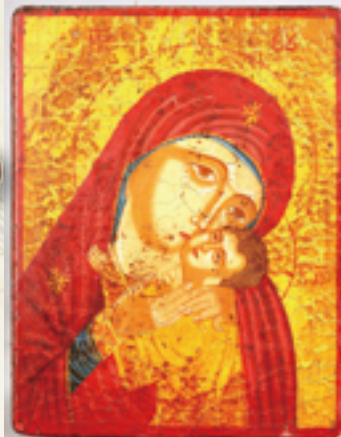
▲聖像畫是東正教禮儀重要的元素，聖母瑪利亞因聖神受孕聖子耶穌，為世界帶來盼望。