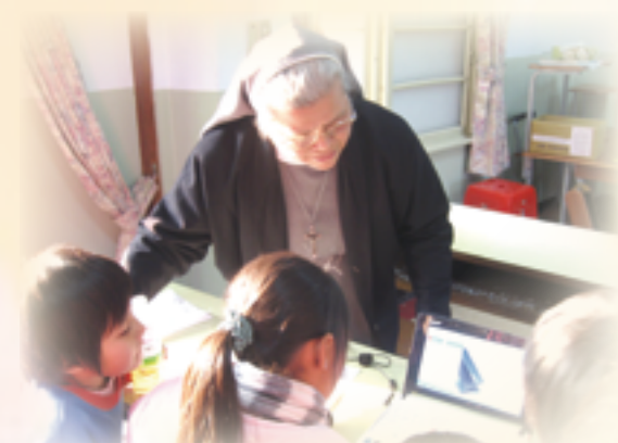
▲天主教博愛基金會長年關懷偏鄉弱勢家庭孩童不遺餘力，誠摯邀請更多民眾發揮愛心，響應公益。

聖誕公益市集由多個天主教善會組織和公益團體設置攤位，包括：天主教善牧基金會、天主教光仁社會福利基金會和光仁文教基金會、主顧修女會奇蹟之家、利伯他茲教育基金會、新事社會服務中心、吳若石神父全人發展協會、天主教道生會、聖吉安娜生命維護中心、主徒修女會、聖家獻女傳教修會、天主教佳播聖詠團、YCS青年天驕隊，以及瑞芳老街