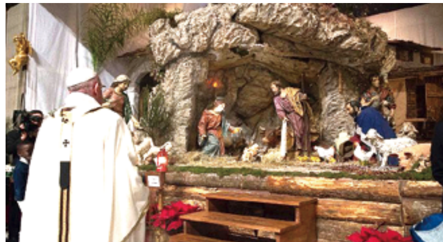
▲教宗方濟各以《美好的記號》宗座牧函闡釋，馬槽為人帶來愛、希望與和平。