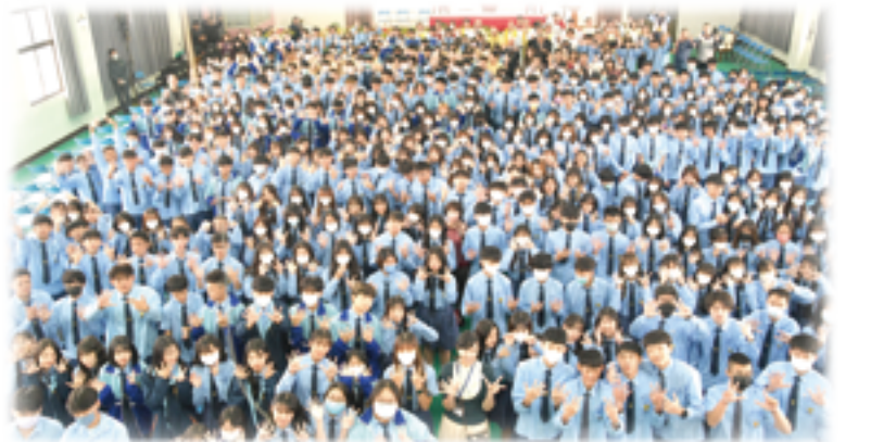
▲參禮全體手比「5」和「8」，齊賀振聲高中58周年校慶快樂！

振聲高中58周年校慶感恩祈福禮，不僅是一場慶典，更是凝聚校內、外共同向前邁進的祈禱與祝福。在未來的歲月中，振聲高中將繼續持守「蹈厲奮發」的精神，傳遞優質教育理念，培育更多優秀振聲人，締造光輝榮景。