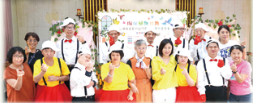
▲仁愛基金會服務團隊及服務對象，懇請社會各界發揮愛心，響應「2024新春LOVE義賣」，一起公益傳愛。