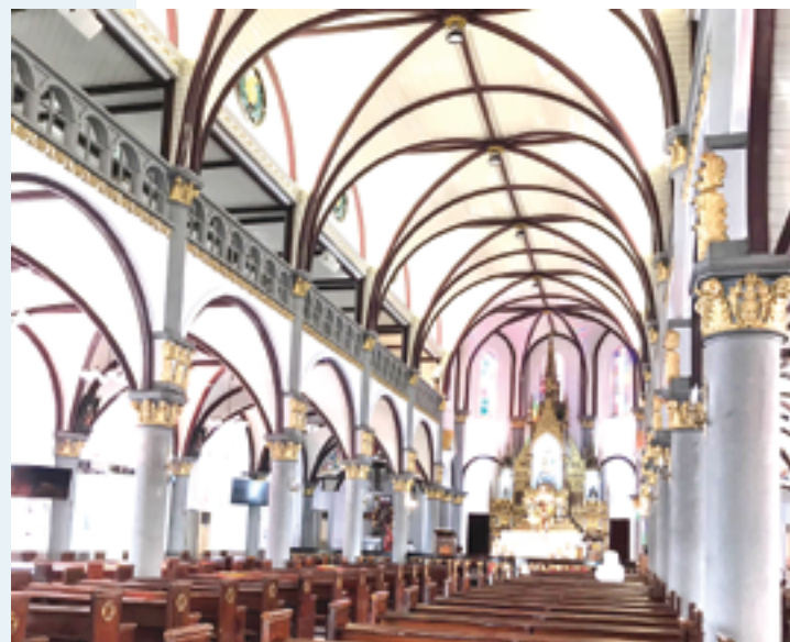
▲高雄玫瑰聖母聖殿主教座堂建築典雅，穹頂富麗，彰顯天主榮耀。

慶祝耶穌誕生是一種必須貫穿我們整個存在的重要態度，這就是我們的真實存在；我不需要取得任何成就或改變真實的自我，只需要醒寤祈禱並停止增強我的虛假自我。我的真實自我是愛、和諧與和平；而虛假的自我，即自私、驕傲、仇恨和報復。讓我們依靠主的力量戰勝那虛假的自我，活出真實的我，帶給身邊的人快慰、鼓勵、讚美、支持、尊重、誠信。