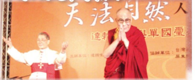
▲2009年達賴喇嘛（右）來台，與單國璽樞機進行「天法自然——人與大自然的對話」跨宗教交談，對單樞機表示高度讚許。