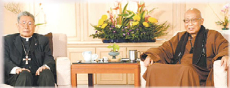
▲聖嚴法師（右）與單國璽樞機心懷慈悲，兩人超越生死，更歡喜暢談生死。

「當基督遇見佛陀」，妙語如珠，玄機深奧，精彩絕倫，滿堂喝采！無怪乎宗教博物館的創辦人靈鷲山心道法師說：「雖然和單樞機的信仰不同，但是對於人類、愛與和平的關懷，如出一轍。單樞機與各宗教間推心置腹的情誼，是我們應該學習的榜樣。」心道法師在得知單樞機逝世時，期勉大家要永遠記得這位偉大聖者，他領導所有信眾以最虔敬的心，每人一句「阿彌陀佛」，獻上千聲佛號，祈願單樞機回到永恆的光明中。