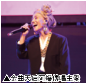
▲金曲天后阿爆傳唱主愛