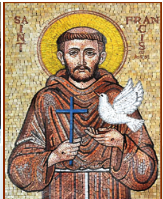
▲聖方濟啟迪馬槽與祭台之間，密不可分的救恩。