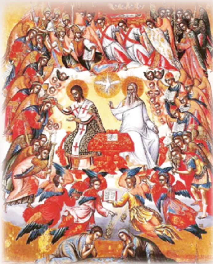
▲禮儀形塑敬拜行動，並以此表現信仰的精神。

在禮儀中，信友以信德讚頌及敬拜那恩賜我們救恩與永生的天主，為回應信友的信德，天主也透過這同一禮儀，恩賜更豐富的祝福；同時，在這敬拜中，信友向天主獻上自己的生命，透過這同一的敬拜，天主也將自己的生命賜予信友們，並因祂神聖恩寵的不斷傾注而