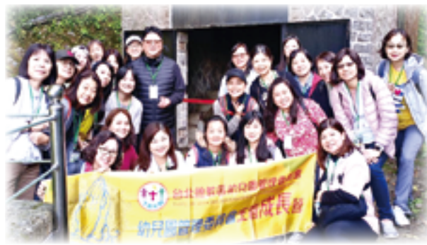
▲幼管會共融至藍寶石泉祕境尋幽訪勝，釋放壓力。