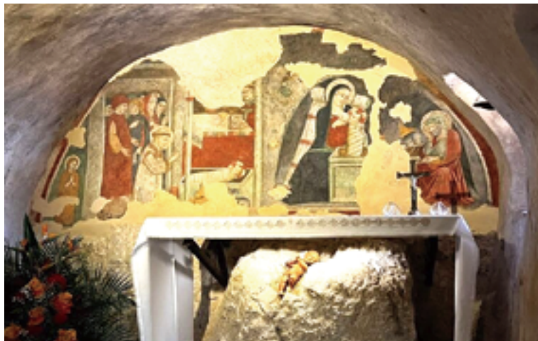
▲格萊齊奧的聖堂內，至今保持著聖方濟800年前的馬槽慶祝傳統，精心布置聖誕馬槽。