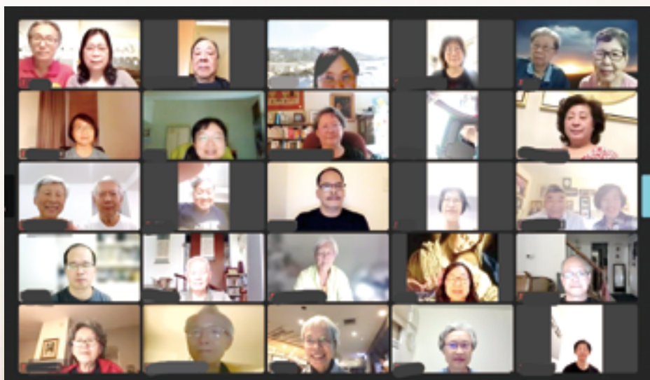
▲基督服務團成員不分海內外，同步於線上分享會，一起追思成道學老師的恩德。

老道從未走遠，他始終還在！而且一直在背後同天主一起看顧與支持我們。因為，那本來就是一個「先知」該作的事啊！