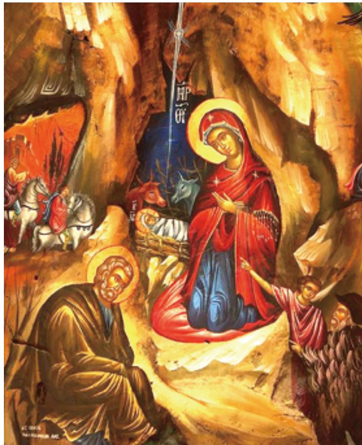
▲耶穌降生成人，為世人帶來救贖的希望。