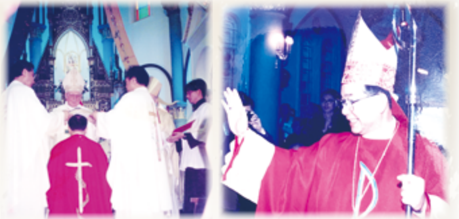
▲▶1998年，葉勝男總主教在高雄玫瑰聖母聖殿主教座堂，隆重舉行晉牧大典。 ◀1998年，葉勝男總主教（左）獲教宗若望保祿二世（右）任命為萊普蒂斯·馬尼亞領銜總教區領銜總主教，並任命為駐斯里蘭卡宗座大使。