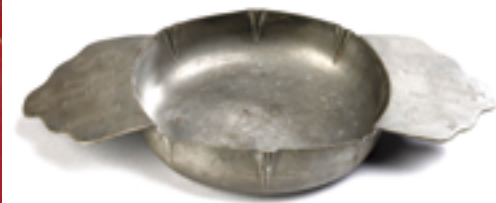
▲天主教禮儀文物，上刻IHS，代表耶穌聖名。