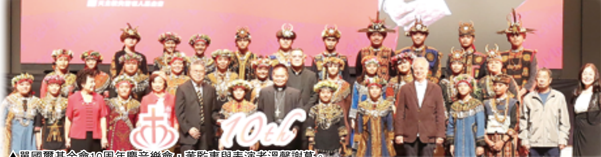
▲單國璽基金會10周年慶音樂會，董監事與表演者溫馨謝幕。