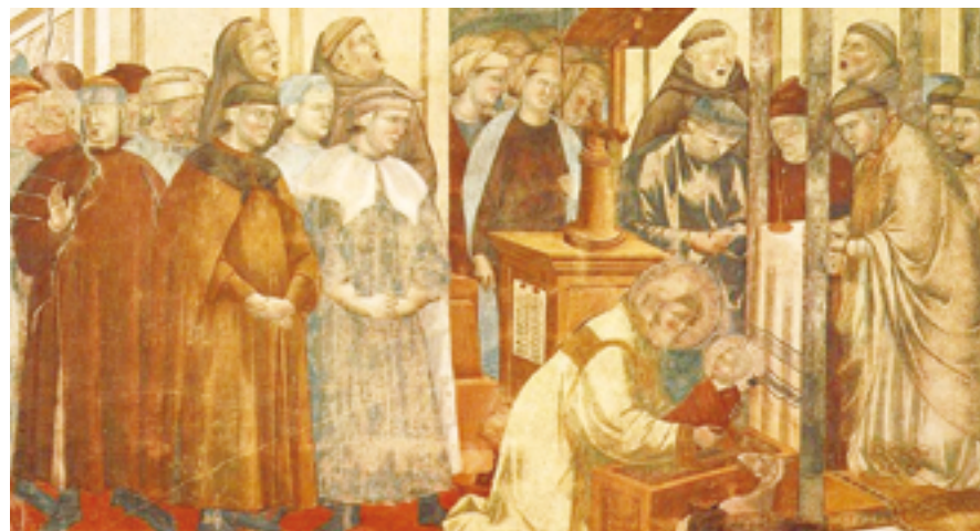
▲聖方濟在主曆1223年以馬槽紀念耶穌聖誕的救恩奧蹟，影響至今。