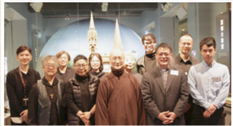
▲《文物開窗：基督宗教裡的新生和福音》開幕禮，主辦單位及貴賓合影。