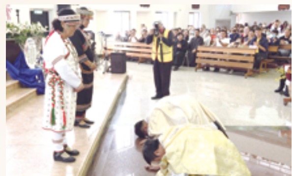
▲兩位新鐸向母親行跪拜禮，感謝養育之恩，並為成全聖召慷慨無私地奉獻。