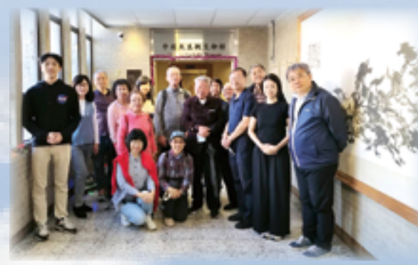
▲一行人在羅光總主教(萬馬奔騰)水墨畫前合影誌念