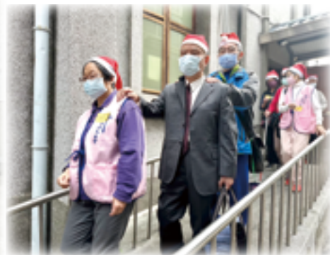
▲友愛團志工們悉心服務及士林耶穌君王堂的無障礙空間設計，讓聖誕聚會因愛無礙。

天主教國際身心障礙者友愛團是身障者溝通往來的教會運動，為建立弟兄姊妹般愛的生活。此運動宗旨在於身障者之間互相幫助的精神，目的是使身障者走出自己封