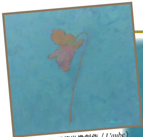
▲巴黎深造時期花肖像創作〈L'aube〉 ▶2018年創作〈Delicate〉