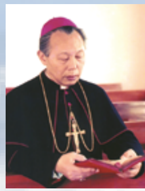
▲羅光總主教畢生貢獻卓越