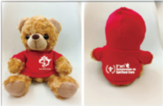
▲特別設計貼心熊寶寶，凸顯醫療傳愛的服務宗旨。