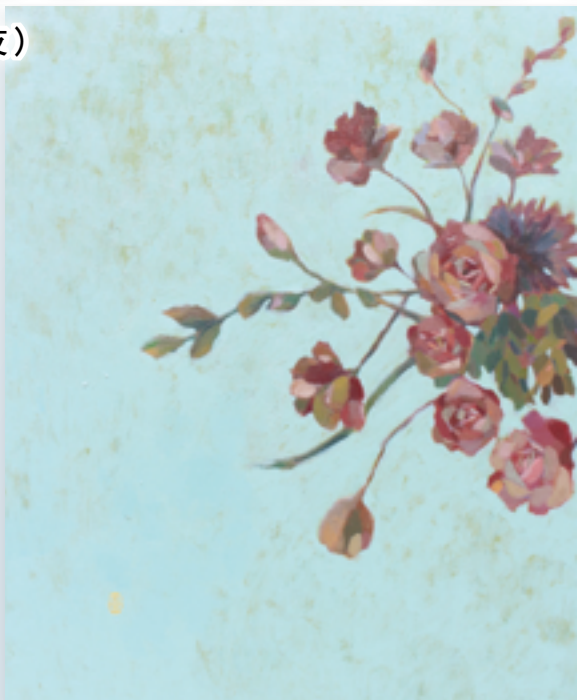
▲〈霧裡玫瑰〉獻給聖母媽媽串串玫瑰經的祈禱。

現地創作計畫「捉春」，當時正值4月初春的時節，我被森林中野生花草的生命力深深吸引，用一周的時間將當地盛開的花草的姿態捕捉，完成一件捉春裝置藝術。