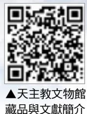
▲天主教文物館 藏品與文獻簡介

■文/孔令信(耶路撒冷聖墓騎士團台灣分團騎士) 圖/婁緯芳(天母天主之母堂教友)