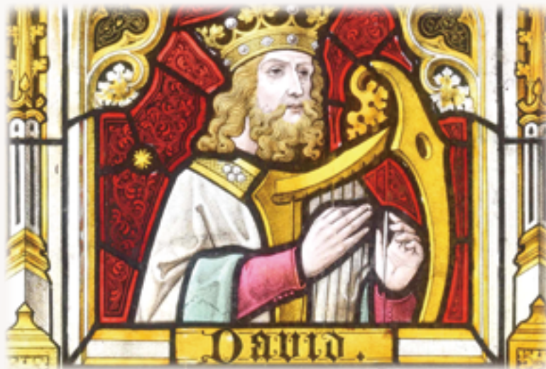
▲聖詠是這些知道天主是誰的人們的詩歌

確實，教會喜歡傳統，但不是因為其舊，而是因為萬古常新。在《聖詠集》裡，我們沐浴在它原始的真誠和完美之中，暢飲它純淨無瑕的泉源。藉著聖詠，我們重溫古代詩人們信德的青春活力，直率地向以色列的天主抒發崇拜