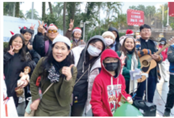
▲天主教神長及教友熱情不落人後，在寒雨的台北市街頭健行，歡喜報佳音。

慶祝聖誕報佳音，是福傳的絕佳機會，祈願引領更多還不認識天主的人明瞭耶穌降生的奧秘，以及「神愛世人」的真諦實意，讓更多的人認識救主耶穌基督所宣講的福音，愛主愛人的教導，願天主的旨意奉行在人間，如在天上。