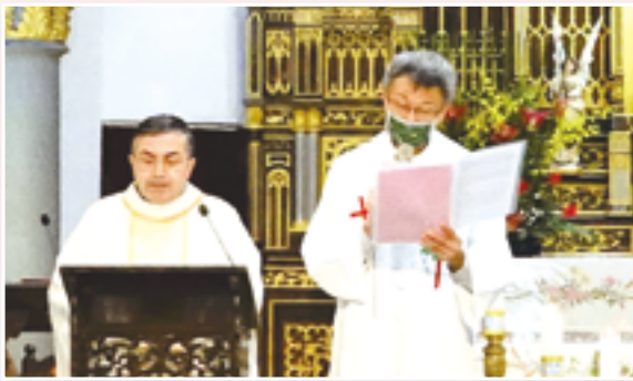
▲左起：馬德範蒙席（左）恭讀教宗方濟各致葉勝男總主教晉牧銀慶賀函，由陳科神父口譯。

劉總主教提及，1998年時任聖座駐澳洲外交使節葉勝男蒙席，獲教宗聖若望保祿二世任命為主教，選擇回到自己的家鄉並選定在領受嬰兒洗禮時的玫瑰聖母聖殿舉行晉牧大典。1998年11月，獲教宗聖若望保祿二世任命為宗座駐斯里蘭卡大使，並擢升為總主教，同年12月20日也在玫瑰