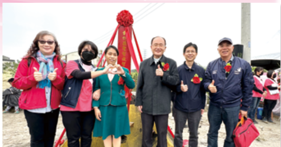
▲蘇耀文主教(右三)與貴賓圓滿完成動土祝福禮，於基地開心合影。

隨後，登場表演的有成功國小同學們活潑的舞蹈及口琴隊的精彩演奏、萬來國小同學及溪州鄉立幼兒園孩童們不畏寒風，精神抖擻載