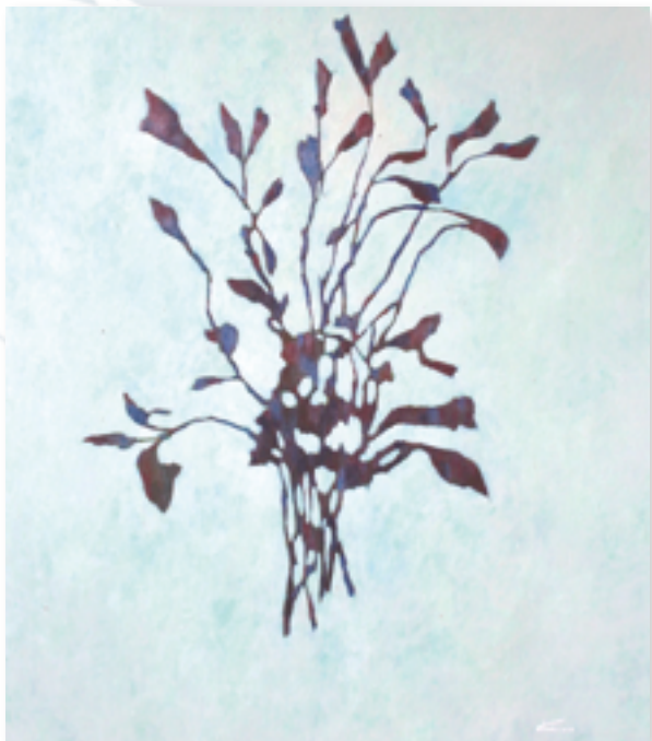
▲〈菁桐野花束〉自在開落，謳歌生命，天主都眷顧。

我認為自己只是創造連結的媒介，透過我的手將盛放姿態用色彩層次捕捉，讓觀者用自己的生命經驗跟畫作產生連結，產生獨特且個人的詮釋方式。教宗本篤十六世曾說過：「人是靈魂、意志，也是自然」，而創作對我來說，就是對受造物存在本身的感謝。