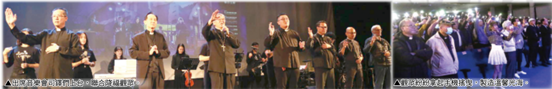
▲出席音樂會司鐸們上台，聯合降福觀眾。