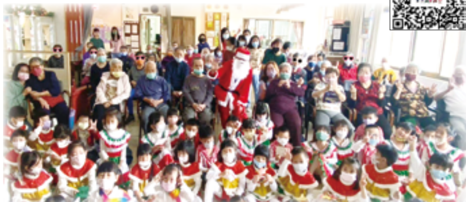
▲德蘭幼兒園孩童們與秋霖園長輩們熱絡交流互動，留下溫馨聖誕回憶。