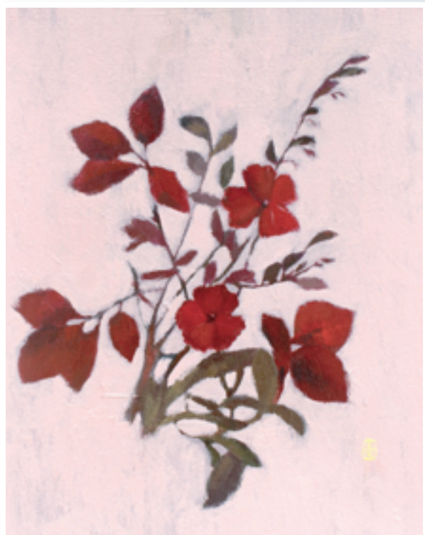
▲〈雨後草叢〉隨處綻放生命力，彰顯造物主的奇妙。