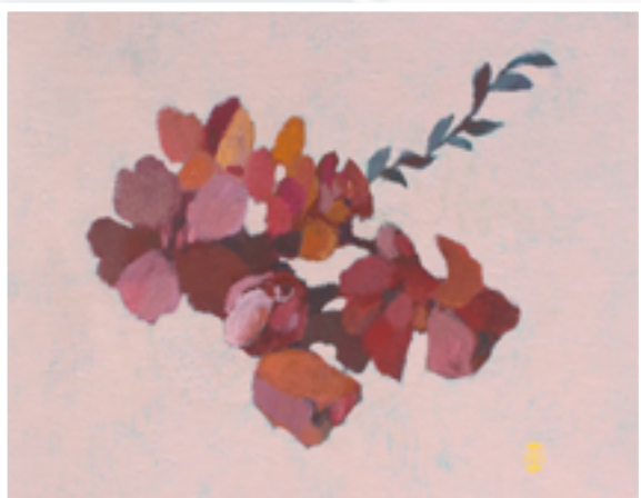
▲〈冬日早晨〉繁花綻放，招展著生命的韌性。

花草繪製在畫布上，花草成為了記憶的載體，我用主觀色彩的堆疊記錄當下創作的片刻，也將自己的生命經驗留存在畫布上。因此也展出最初在巴黎開始的《花肖像》系列。氣味和視覺經驗同樣是相當主觀的感受，每個人眼睛所接收到的色彩都略有不同，就如同每個人所聞到的氣味感受皆有差異。