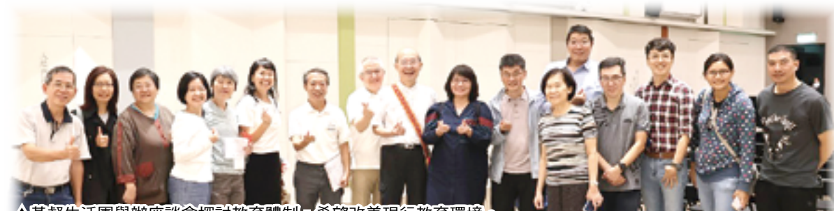
▲基督生活團舉辦座談會探討教育體制,希望改善現行教育環境。