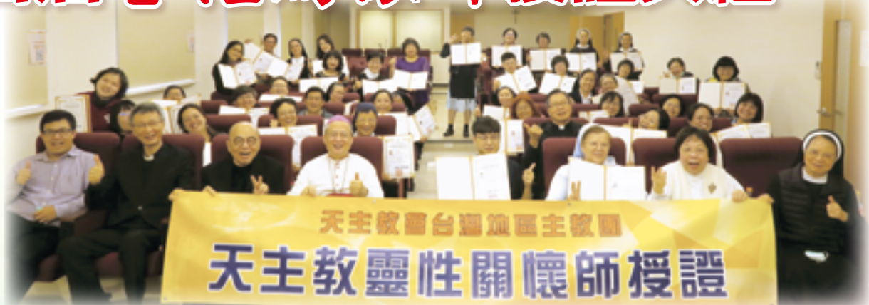
▲靈性關懷師授證典禮後，主禮李克勉主教（前排左四）與參禮神長及50位授證靈性關懷師歡欣合影。

聖若望保祿二世將教廷的「聖座萬民福音傳播部」及「宗座促進新福傳委員會」整併為「福音傳播部」的歷史說起，無論是有信仰的或是沒有信仰的，福傳都要回到梵二的精神，也就是回到初期教會、回到《聖經》、回到耶穌身上，每位靈性關懷師都是與耶穌相遇的人，也在這樣的生命根基上反省靈性、從事靈性關懷，想想那位百夫長及客納罕婦人，以謙虛的信德不斷歸依，並融入新福傳的精神，讓迷失方向深陷痛苦的人看到救主慈悲的面貌。依靠聖神，而不是依靠主教、神父，因為靈性關懷常是在殘酷現實中與唯一的救主相遇，與此同時，也不忘記靈性關懷師是跨越宗教，要在照護團隊中想辦法找到與人同道偕行的契機。