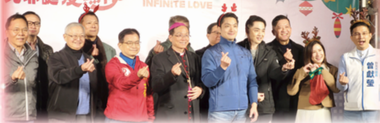
▲天主教鍾安住總主教（前排左四）、饒志成神父（前排左二）等神長，與基督教牧者齊心為台北市市政祈禱。

台北市觀光傳播局於12月23日舉辦「2023台北耶誕愛無限·健走報佳音」，台北市蔣萬安市長配戴聖誕頭飾，率隊自真理堂徒步出發，沿著新生南路，行經公館商圈，至自來水園區入口廣場終點站，沿途與民眾報佳音、發送聖誕小禮物，傳遞愛與幸福，將上主的祝福帶給台北市民，讓公館商圈洋溢溫馨歡樂的節慶氛圍，與民眾共度美好佳節。