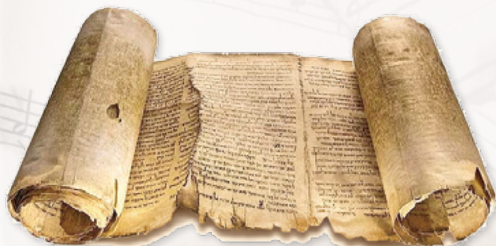
▲《聖詠集》是最完美的祈禱書，蘊含著天主的奧秘。

教會的禮儀是讓我們進入最深刻、最真實內在生活的鑰匙。如果我們能夠真正地學會認識和喜愛聖詠，我們就可以感受到教會自己對於神聖事物的經驗，也可以獲得對天主應有的認識。這就是為什麼，教會始終相信聖詠是讚美天主最好的方法。（下期待續）