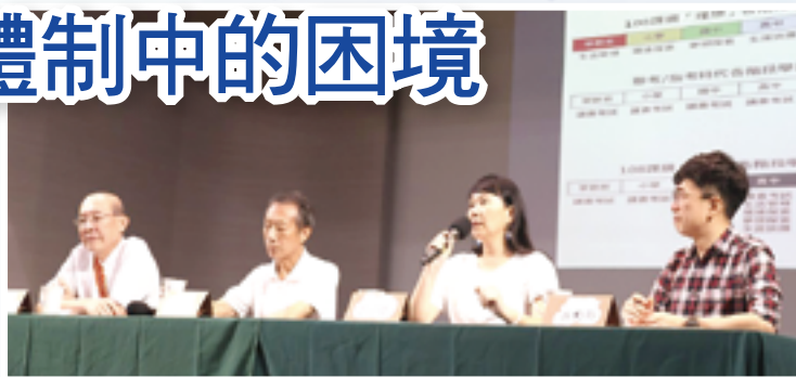
▲左起:木頭老師、唐傳義教授、季紅瑋老師、林楨邦老師探討總統候選人的教育政策,並為目前教育體制提解方。

有進一步落實改革的機會。謝謝3位與談人在偏鄉和補教界第一線的分享,希望自己能有參與的機會,也希望能吸引更多教外人參與。