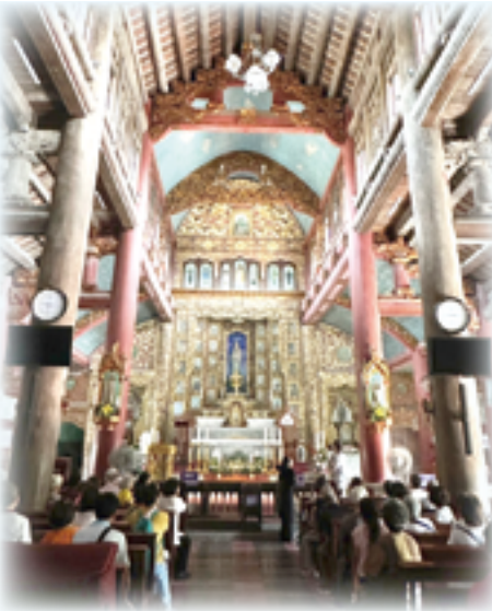
▲發聾教區玫瑰聖母主教座堂建築富有特色，引人駐足。