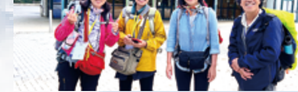
▼CICEA4位會員代表與會，是台灣唯一受邀出席團體。