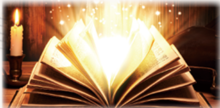
▲從《聖經》裡尋找讚美天主的方式，這是天主賜予的寶藏。