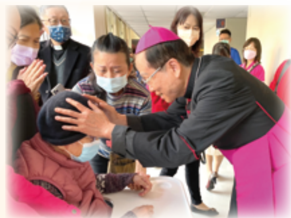
▲鍾安住總主教(右)降福長輩，讓家屬感動不已。