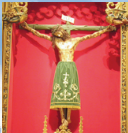
▲Camino途中，讓人感動的耶穌受難像。