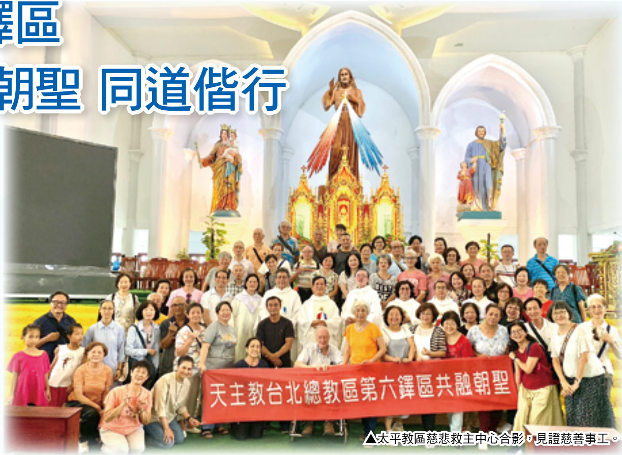
▲太平教區慈悲救主中心合影，見證慈善工。

第5天中午參觀拉望聖母朝聖地。18世紀末，受迫害的天主教徒逃到拉望躲在雨林裡，有人