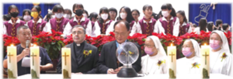
▲馬德範蒙席（前排左二）、蘇耀文主教（前排左三）與聖母聖心修女會及曉明女中代表等，共同舉行聖誕點燈儀式，喜迎耶穌降生。

蘇主教並祝福道：「聖母聖心修女會修女們創校時，以『曉明』為校名，是希望所有曉明人都能效學聖母的純樸和謙遜，以及默默奉獻自己，關懷人群，敏察別人需要，並培養主動積極幫助他人的愛德，如同曉明之星一樣，消除黑暗、頹喪，帶來光明、希望。在這感恩與祝福的時刻，懇求曉明女中的主保、我們的典範、每個人的好母親