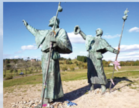
▲Camino最後5公里路，歡樂山地標——朝聖者雕像。