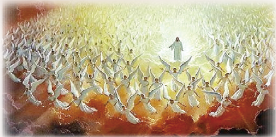
▲《聖詠集》的詩歌，是人面對天主時，狂喜的呼聲，使我們在基督之內，並與祂共融。

然而即使如此，聖詠同時也是壯美而嚴肅的。詩歌所蘊含的情感節制有度，加上教會在使用聖詠時的高度慎重，我們可以看到聖詠的巨大撞擊力道乃是埋藏在一個很深的神修層面當中，我們必須處在這個層面中祈禱，才能感受到這份撞擊力道。然而，說聖詠深刻，並不是意指聖詠是神秘的；所以，我們並不需要賦有什麼特殊的品質才能欣賞這些詩歌。只