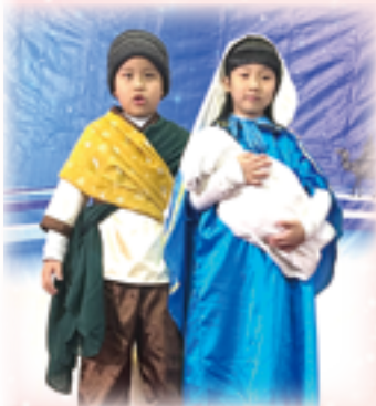
▲精心製作的服裝與道具、生動演出，使福音劇叫好又叫座。

今年聖誕音樂饗宴由平安二家打頭陣，緊接著，福音劇後第一個節目〈天父的花園〉班上的幼兒在陸神父的書房準備時，有3位幼兒有一點情緒，沒想到一到我們要上台表演時，平安二家全部的幼兒笑咪咪，又唱又跳，好厲害，毫不怯場，相當有勇氣。感謝父母們平時在家協助幫忙練習，才有這樣好的表演。有了這次成功的經驗，相信下一次演出會更好。