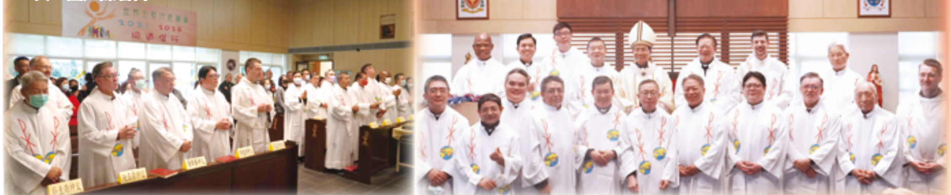
▲台北總教區新就職主任司鐸們齊聚一堂，為順服鐸職派遣虔誠舉祭。