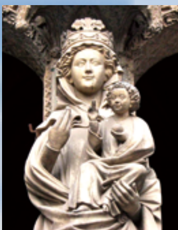
▲Camino沿途聖母與聖子態像，提醒我們聖誕的奧秘。