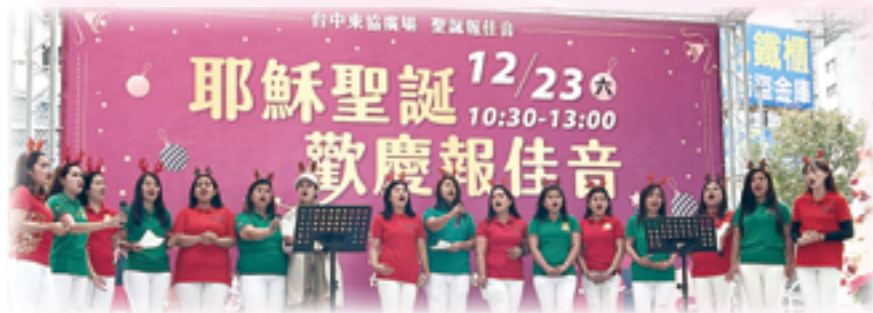
▲潭子堂區菲律賓教友們悠美的和聲，讓人沉浸在濃濃的溫馨聖誕氛圍。