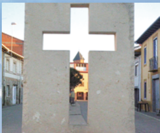
▲每一次的Camino朝聖，都是朝聖者不斷地超越自我，朝向十字架，與主相遇的喜悅。