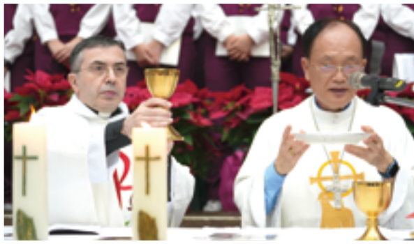
▲曉明女中創校60周年彌撒聖祭由蘇耀文主教（右）主禮，教廷代辦馬德範蒙席共祭，氣氛隆重溫馨。