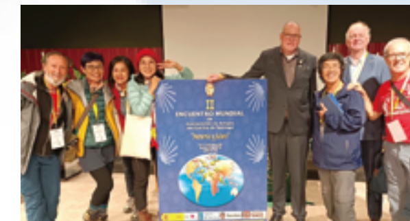
▲參與世界大會的CICEA核心會員與主辦單位夥伴們合影。