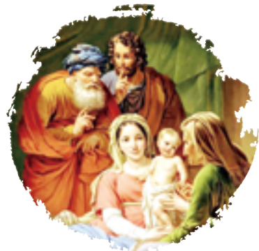
世界祖父母及長者日 2023教宗教理講座 6