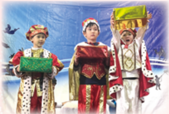
▲孩子們以流俐的美語演出福音劇〈三王來朝〉，台風穩健，充滿自信，表現可圈可點。