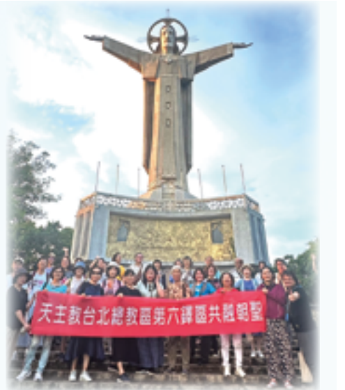
▲頭頓基督君王像舉世聞名，彰顯天主大能。

第3天早上，參訪太平教區耶穌聖心主教座堂，和同一教區的慈悲救主中心，該中心是為照顧貧弱無家可歸的老人及智障兒童而設，靠社會善心人士的奉獻及支持。餐後，中心安排我們與住民們見面，神父與修女們對住民的愛心令人感動，團友們紛紛慷慨解囊。