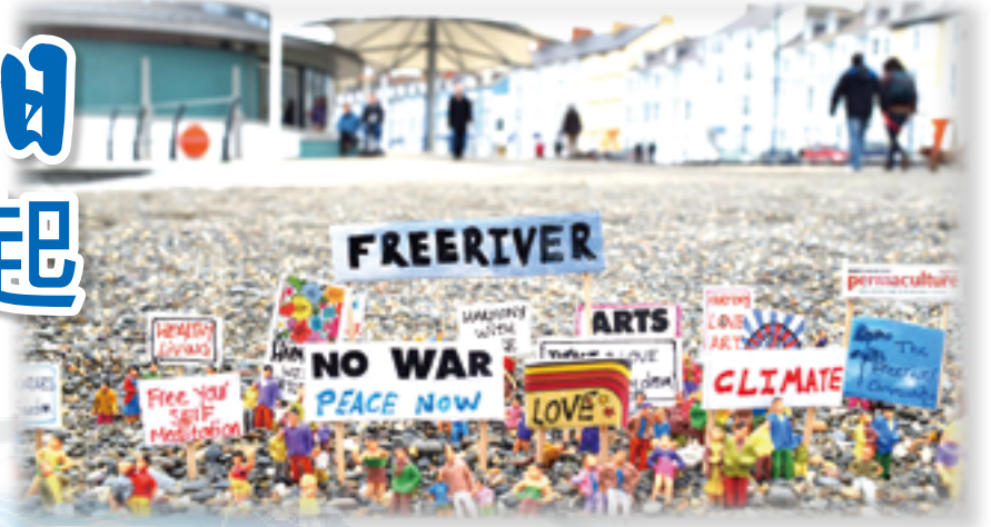
▲教宗方濟各邀請普世教會為世界和平祈禱，並呼籲人工智慧不應成為戰爭武器。

何謂人權： 教宗堅信人工智慧所帶來的熱門倫理議題，包括了歧視，操縱或社會控制。人工智慧的演算程式是無法理解我們之所以為人類，所具備的人權，它永遠也無法演算出人類與生俱有的基本價值中的同情、憐憫與寬恕等特質。