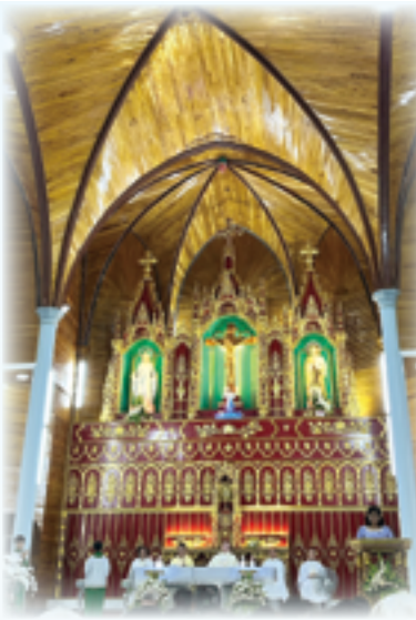
▲感謝當地教友大力幫忙，能在榮市教區福安教堂彌撒共融。