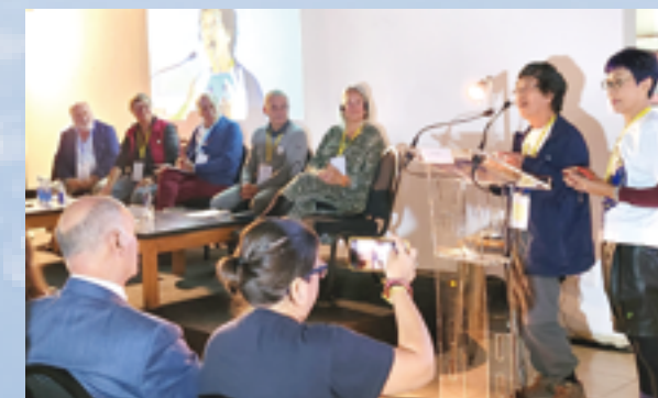
▲CICEA核心成員專題報告發展情形，讓世界聽見台灣。