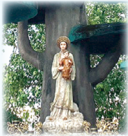
▲聖母曾在拉望顯現，幫助受迫害的教友，神蹟使朝聖者絡繹不絕。

第2天早上，我們參觀著名的世界自然奇觀「下龍灣」及有岩洞奇觀之稱的「天宮洞」，洞內的石柱和石筍樣態各異，令人稱奇，真是別有洞天。