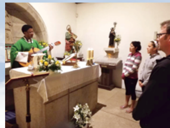
▲朝聖者不約而同來到歡樂山的小聖堂，參與感恩彌撒。