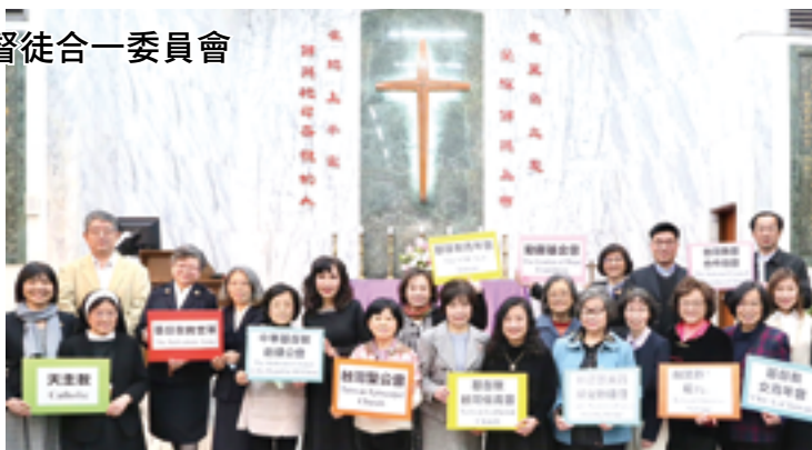
▲主教團基督徒合一委員會每年與基督教各宗派舉辦合一共融活動，見證天主賜予不同基督徒團體的神恩。

應該要強調的是，人無法獨自分辨自己是否擁有神恩，以及是哪種神恩。我們常聽到有人這樣說：「我擁有這種特質，我唱歌很好聽。」