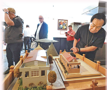
▲安平天主教文物館館內館藏相當豐富，令參訪者嘆為觀止。